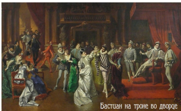
Бастуан на троне во дворце