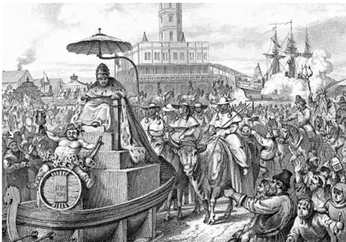
Большой маскарад в Москве: празднование Ништадтского мира. С 31 января по 4 февраля 1722 года

Московские простолюдины любили кулачные и палочные бои, которые собирали массу зрителей. Участники разбивались на две группы и наступали друг на друга стенкой. Начиналась потасовка, причем в азарте так нещадно бились, что нередко побоища кончались смертными случаями. Но жизнь в Московской Руси ценилась дешево.