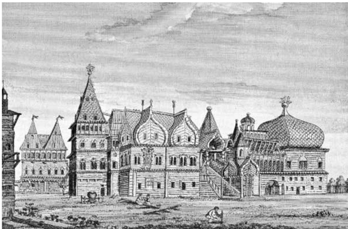
Дворец царя Алексея Михайловича в Коломенском

Главным несчастьем Москвы по-прежнему оставались пожары, уничтожавшие зачастую целые слободы и уносившие жизнь многих людей. Датский посол в Москве Юст Юль записал около 1710 года: «Когда видишь здесь начинающийся пожар, становится страшно. Так как почти весь город построен из леса, а пожарные учреждения плохи, то огонь распространяется до тех пор, пока есть чему гореть».