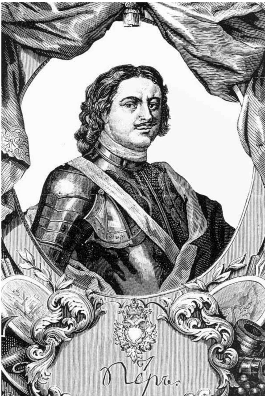
Царь Петр Алексеевич Романов (1672-1725)

Кремлевский дворец оставался царской резиденцией. Его занимали царевна Софья Алексеевна и царь Иван Алексеевич. В Кремле действовало правительство, оттуда производились назначения, там устраивались дипломатические церемонии.