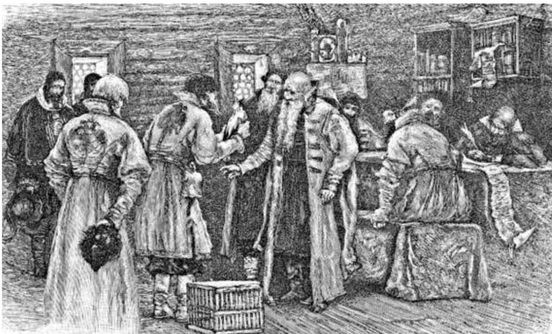
Осмотр белой вороны в Преображенском приказе