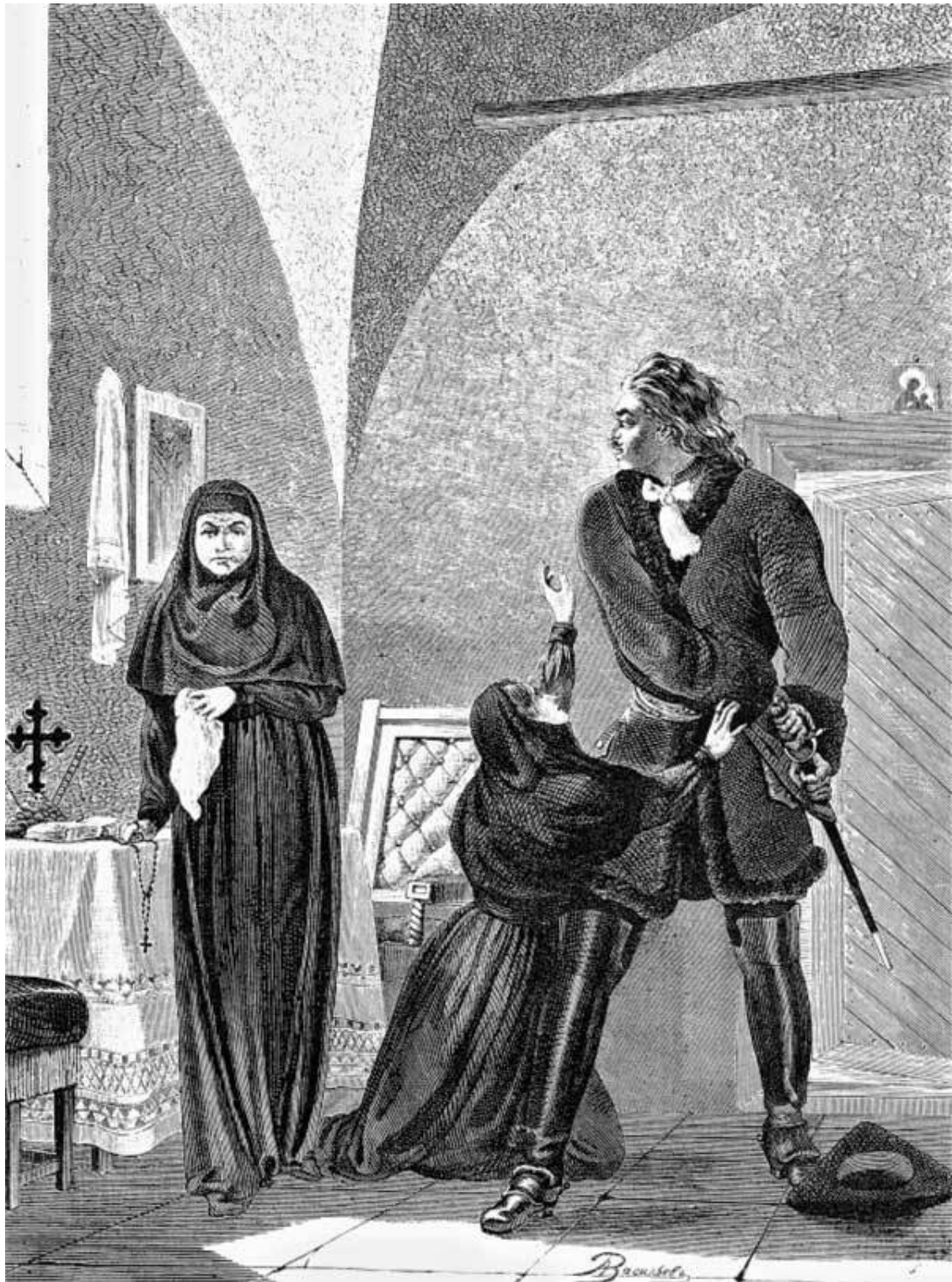
Петр I в келье царевны Софьи

Петр I вернулся из Европы в иноземном платье и вскоре принялся вводить новшества в старозаветный быт москвичей. Лишь крестьяне и духовенство избегли этой участи. Историк первых десятилетий XIX века А. Ф. Малиновский отмечал: «Брить бороды и носить европейское платье государь Петр I повелел при наступлении XVIII века, 1700 [года] января 4-го. Через двенадцать дней появились на всех городских воротах развешенные для образца кафтаны, и жители московские, исполняя волю царскую, чрез одни сутки преобразились. Скоро дошло дело и до женских нарядов; московские щеголихи должны были расстаться со старинными