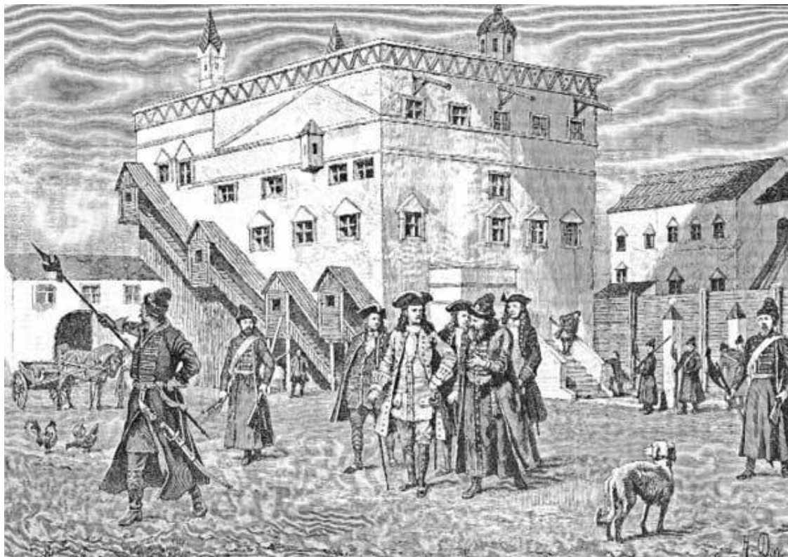
Прогулка посла по двору Посольского дома в XVII веке

По указу 1709 года было введено новое административное управление – восемь губерний во главе с губернаторами. Москва возглавила огромную губернию, к которой принадлежали Владимир, Калуга, Коломна, Можайск и еще 35 окрестных городов (в 1719 году по новой реформе часть власти перешла от Москвы местным воеводам).