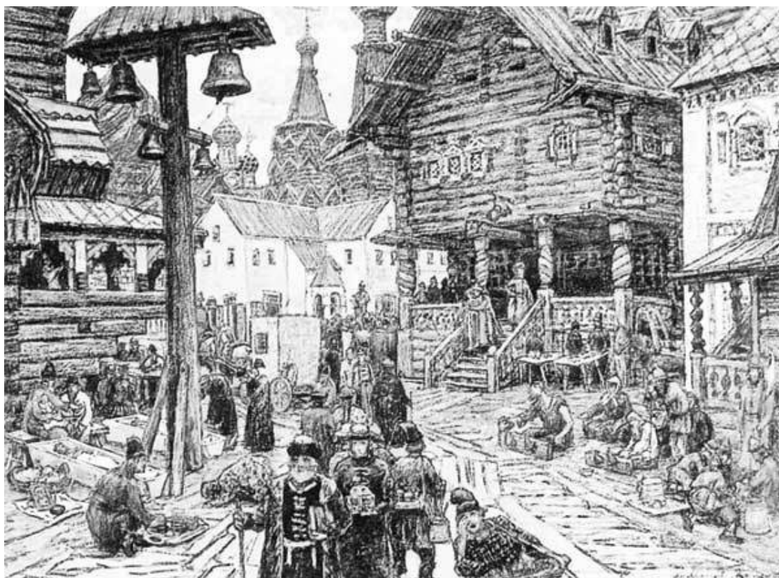
На крестце в Китай-городе

В 1701 году выгорел почти весь Кремль, на следующий год – Посольский приказ в Кремле. В 1709 году пожар уничтожил многие улицы в Белом и Земляном городе. Требовались более современные, организованные мероприятия по борьбе с огнем. По указу 2 мая 1711 года гарнизонные полки стали снабжаться пожарными инструментами – топорами, ведрами, лопатами, крюками, баграми, насосами. На больших улицах предписывалось иметь «заливные трубы медные с рукавами». Для изготовления таких труб выстроили небольшую мануфактуру. Несмотря на эти меры, 1712 год ознаменовался самым опустошительным пожаром в эпоху Петра I, сгорело 9 монастырей, 56 храмов, более 4500 дворов.