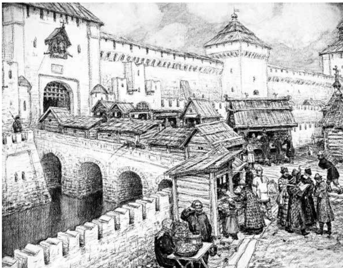
Книжные лавочки на Спасском мосту в XVII веке

В XVII веке наиболее крупными московскими мануфактурами были Пушечный двор на Неглинной, Оружейная палата с ее разнообразными мастерскими и с работавшими на дому мастерами, Кадашевский Хамовный двор, где было организовано производство полотна как на