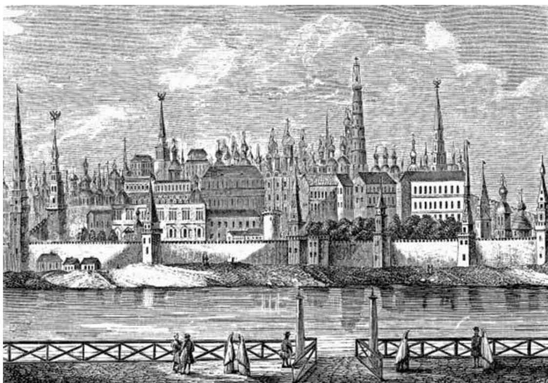
Московский Кремль в XVII веке

Красная площадь в начале царствования Петра была беспорядочно застроена мелочными лавками, палатками и шалашами. По указу Петра всякую торговлю на площади запретили, и все строения были снесены.