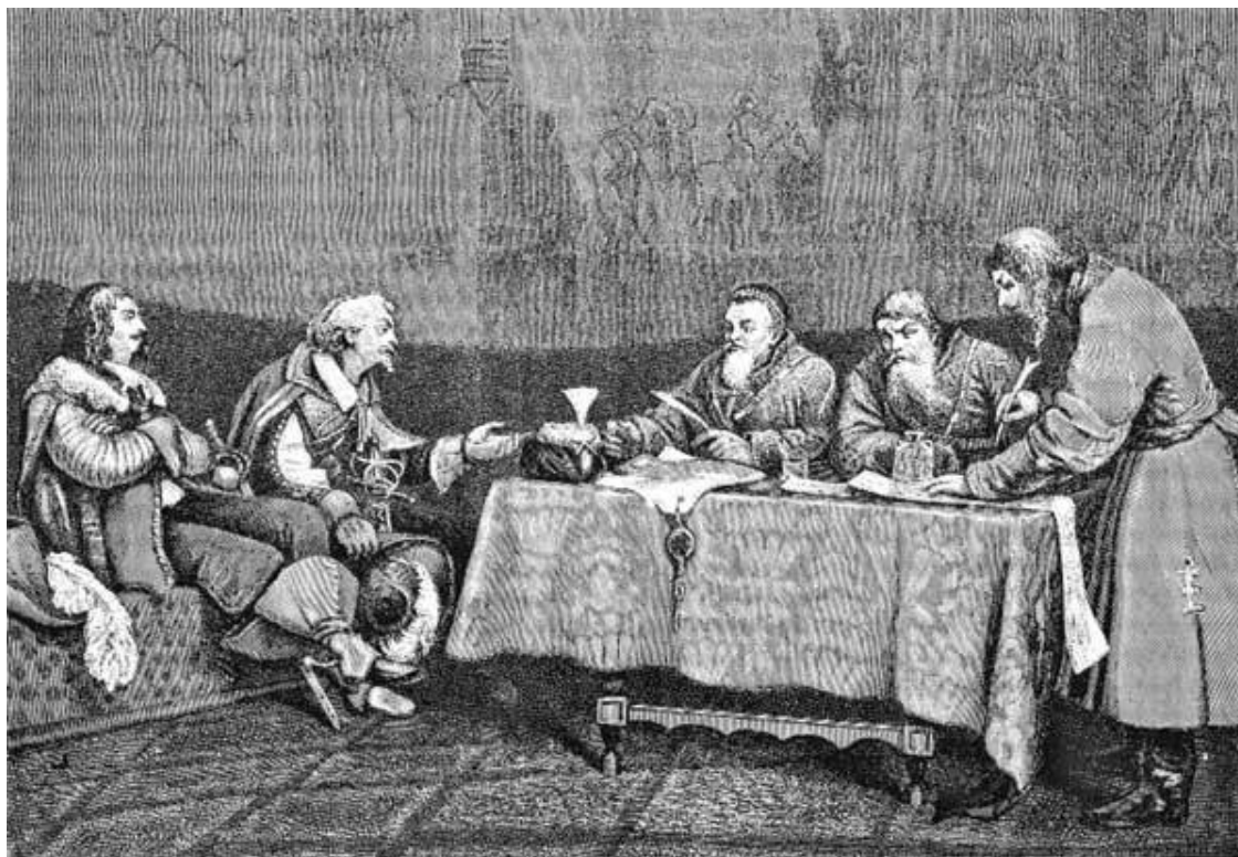
Иностранные посланники в Посольском приказе

Во главе Московской губернии ставились близкие к Петру I люди. Первым московским губернатором был боярин Т. Н. Стрешнев – воспитатель молодого царя, возглавлявший Разрядный, а затем Военный приказ. Стрешнев пользовался особым доверием царя: отправляясь за границу, именно ему вместе с Ф. Ю. Ромодановским он поручил управлять государством.