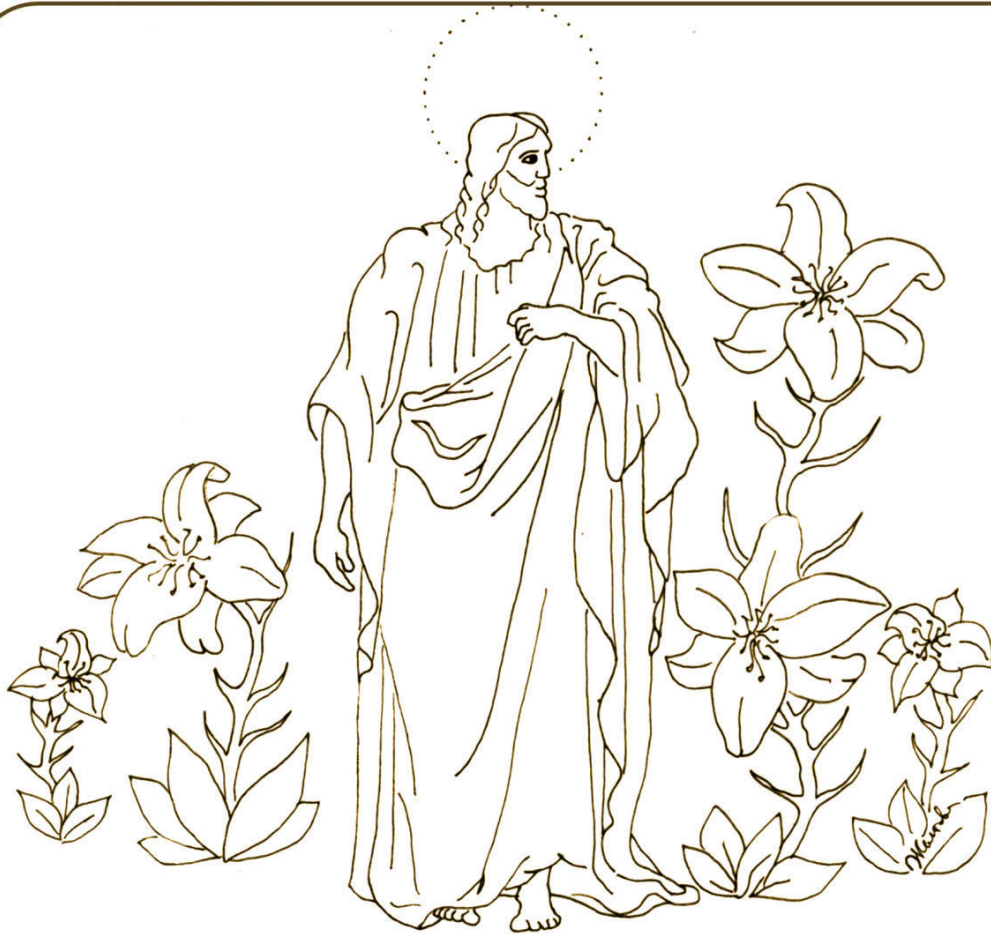
СЛОВНО ЛИЛИИ БЕЛЫЕ