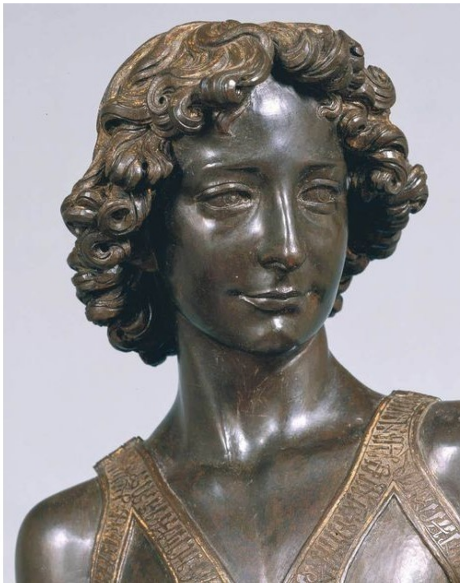
«Давид» скульптора эпохи Возрождения Андреа дель Вероккьо