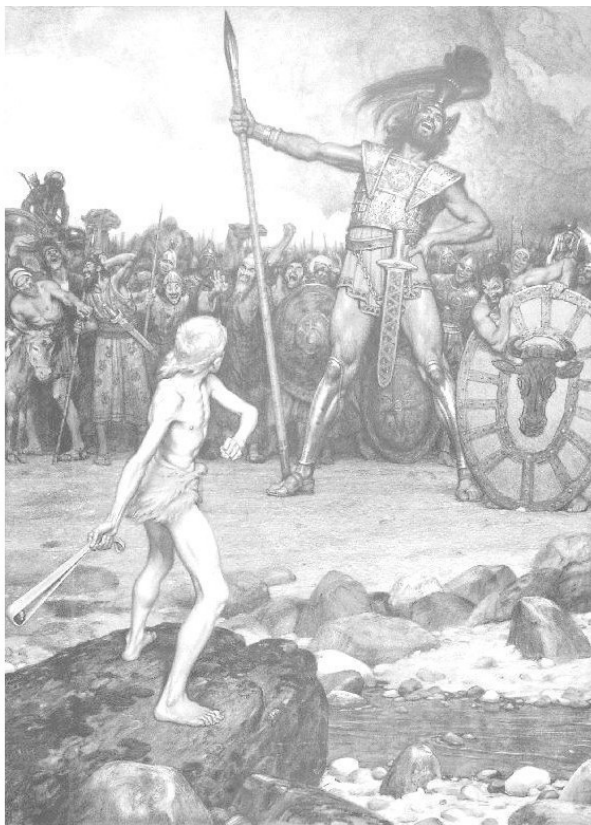
Осмар Шиндлер «Давид и Голеаф» 1888 год.

– Выберите у себя человека, пусть он придёт и сразится со мной. Если убьёт меня, мы будем вашими рабами. Если же я одолею его, то вы будите нашими рабами и будите служить нам вечно.