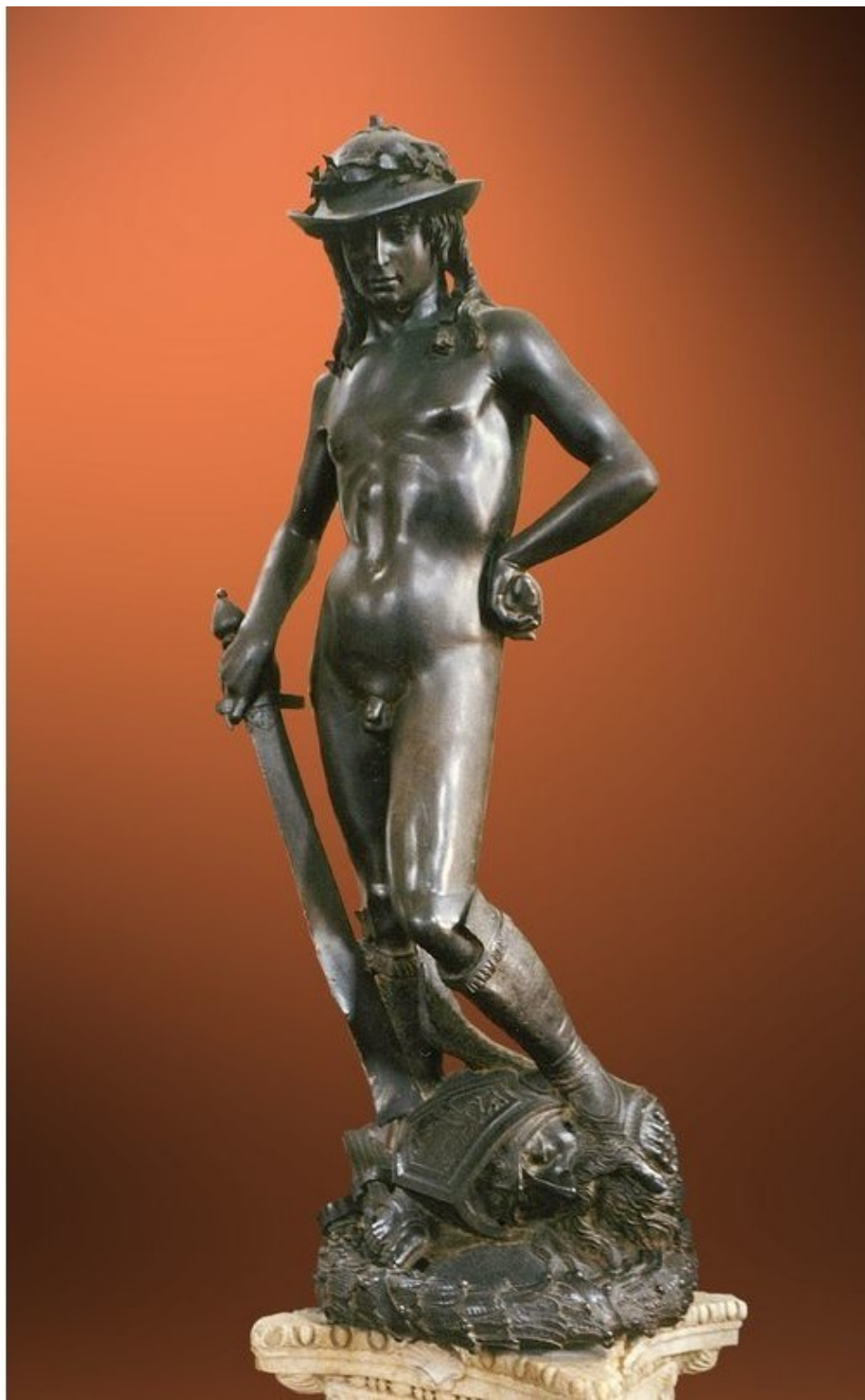
«Давид» – бронзовая скульптура работы Донателло.

– Хе! – недовольно хмыкнул попугай. – Так чё я реву? Сразу сказать не мог, что кончится всё хорошо. Сколько слёз зазря пролил, чем я теперь плакать буду?