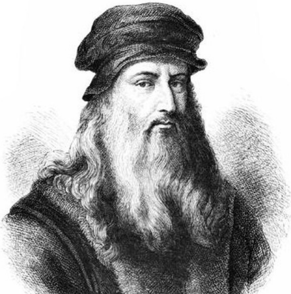
Автопортрет Леонардо да Винчи.

В пещере Томазо Мазини было, как всегда, свежо и царил полумрак. Хозяин сидел у горевшего канделябра перед раскрытым сундуком с пергаментными свитками, пластинками из камня и меди.