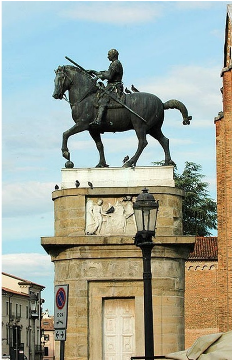
Памятник «Гаттамелату» работы Донателло.

– Смотрите, – мама вскинула руку в направлении спокойно шагающей лошади. – Он как будто покидает собор.