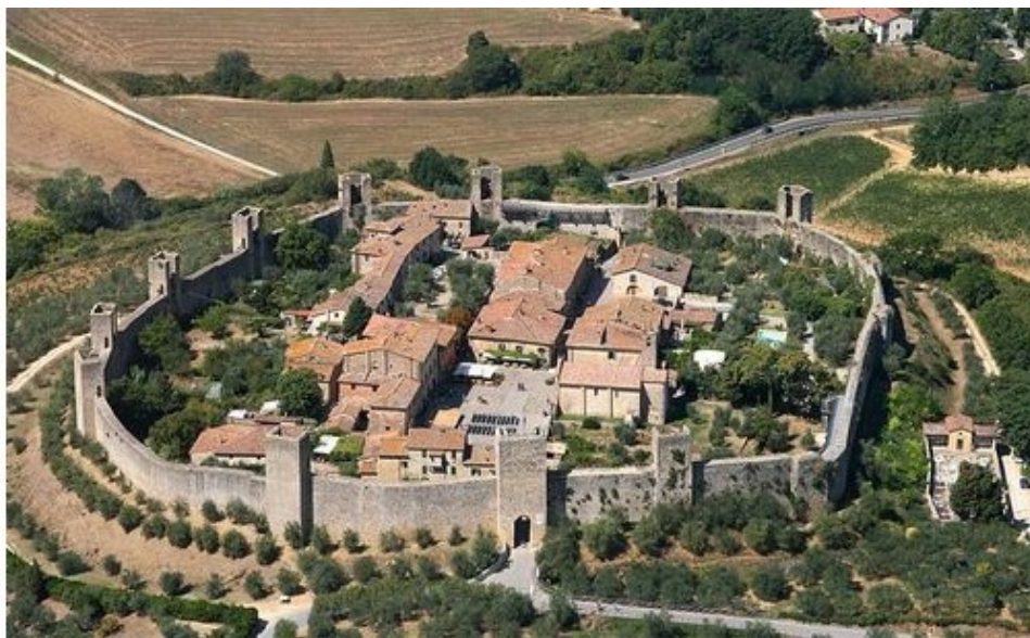
Фото деревушки Монтериджони с высоты птичьего полёта.