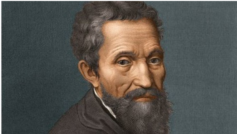
Портрет Микеланджело. Художник М. Венусти около 1535 года

– Нет, вы видели этого глупца?! – возмущалась бабушка Лючия, сидя на кухне и с удовольствием поедая испечённый бабушкой Василисы курник. 54