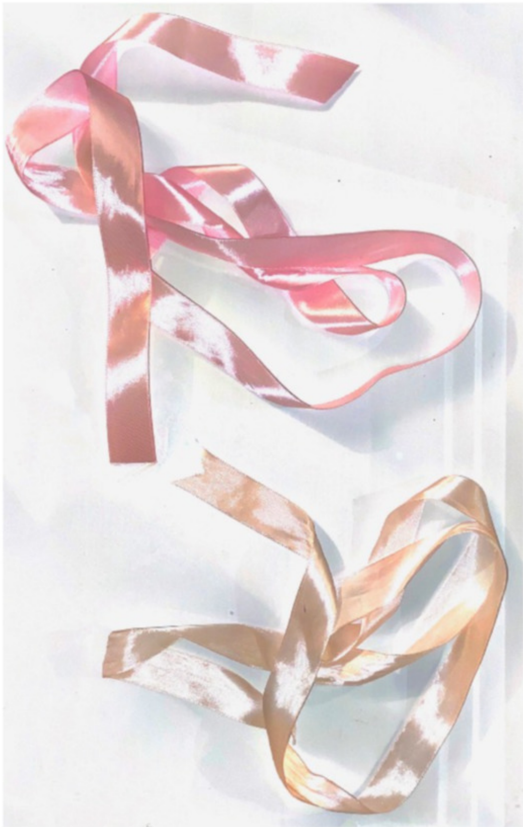
Ленты одинаковых букетов, но от разных людей.