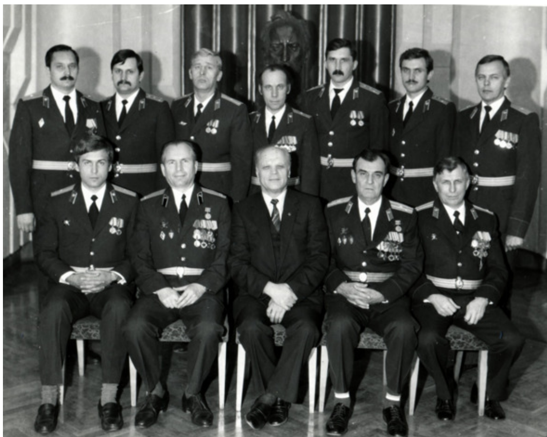
Воины-интернационалисты в Краснодаре

В 1980—82 годах сменилось 3 состава команды. Весь личный состав проявил себя достойно, выполнил все задачи, большая часть сотрудников были представлены к государственным наградам СССР и Афганистана. Главное – потерь личного состава не было.