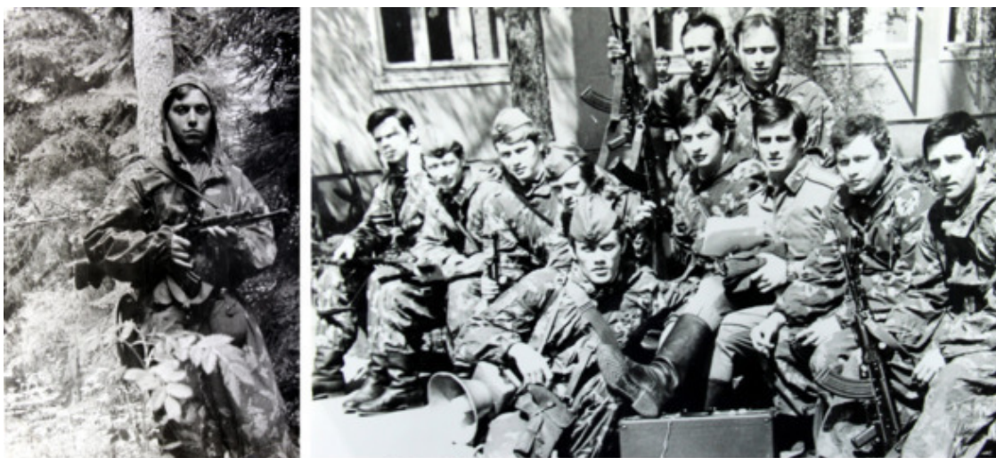
Учёба 1978 г.

На огонь ставим предполагаемую для приготовления емкость – блюдо и приступаем к кипячению желательно чистой родниковой воды. В крутой кипяток бросаем приготовленные заготовки и варим до появления легкой пенки.