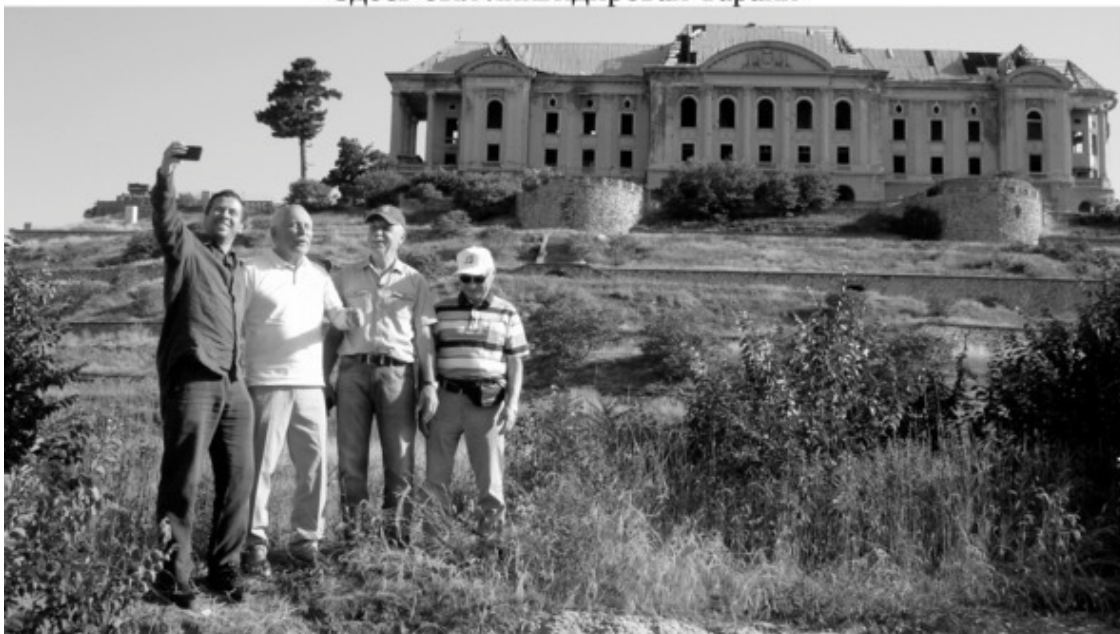
На месте боев 38 лет спустя

Именно эти люди, ветераны спецподразделения проявили свою политкорректность и вспоминали, как военнослужащие разных национальностей и вероисповедания со всех республик Союза решали сложнейшие задачи по защите национальных интересов страны в дружественном соседнем государстве. А историй у всех участников событий всегда было много. Только надо настроить седовласых ветеранов на воспоминания и реки информации потекут прямо в книгу.