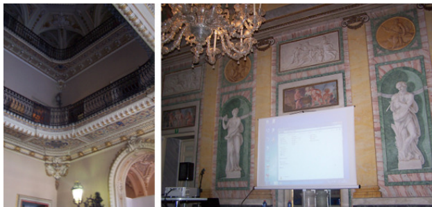
Интерьеры виллы Olmo

женного давно посередине садов, и которого уже нет. Старинный сад, с огромными деревьями и большими пространствами для отдыха, произрастает за виллой поныне. Гостями виллы были аристократы, императоры Австрии, королевы Сицилии и Сардинии, Д. Гарибьди и многие другие почётные люди. В 1883 году новый владелец придал вилле современный вид, построив два крыла, театр, балконы; были снесены конюшни, благоустроен сад.