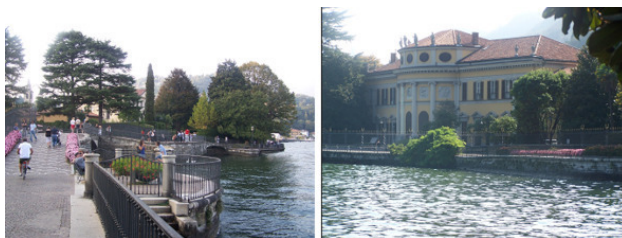
Справа – villa Saporiti

Здесь не циркулирует городской транспорт и автомобили. Проложены пешеходные и велосипедные дорожки, разбиты цветочные клумбы. Под тенью магнолий, сосен и других раскидистых столетних деревьев установлены лавочки для отдыха.