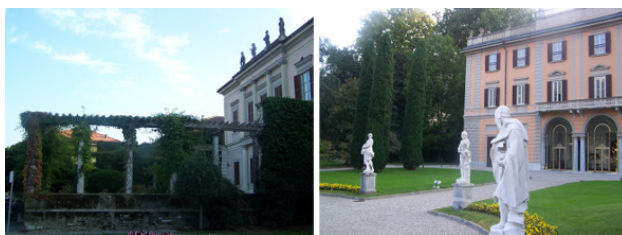
Античные колонны; фото справа – villa Gallia

Здесь не циркулирует городской транспорт и автомобили. Проложены пешеходные и велосипедные дорожки, разбиты цветочные клумбы. Под тенью магнолий, сосен и других раскидистых столетних деревьев установлены лавочки для отдыха.