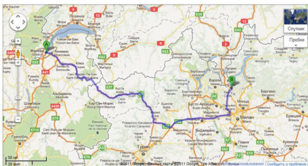
Скриншот карты Google Maps, маршрут Женева-Комо

Полный бак топлива, на спидометре 131805 км. По GPS-навигатору до цели – 371 км, время в пути – 3 часа 45 минут. Обычно к расчетному времени прибавляем 1 час на остановки. На карте Google Maps представлен маршрут в одну сторону: Женева-Комо. Обратный, абсолютно иной маршрут, будет показан по участкам на отдельных картах (ниже по тексту).