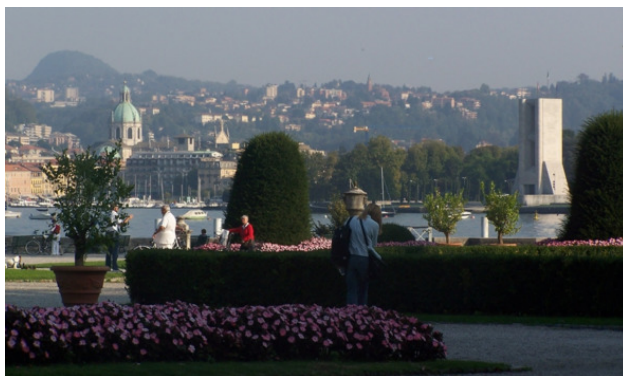
Вид от виллы Ольмо на город Комо

На следующем фото – панорама центра города Комо. Слева в кадре – круглый купол собора Duomo di Como, а справа – на берегу озера высится городской Мемориал. Видно, что над городом стоит атмосферная дымка после дождя.