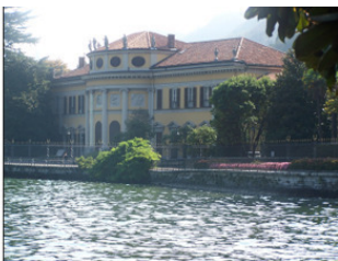
Справа – villa Saporiti

Здесь не циркулирует городской транспорт и автомобили. Проложены пешеходные и велосипедные дорожки, разбиты цветочные клумбы. Под тенью магнолий, сосен и других раскидистых столетних деревьев установлены лавочки для отдыха.