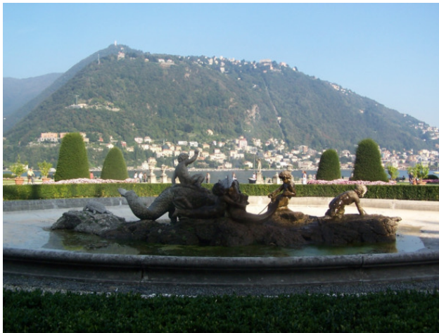
Фонтан и вид на гору Брунате

На следующем фото – панорама центра города Комо. Слева в кадре – круглый купол собора Duomo di Como, а справа – на берегу озера высится городской Мемориал. Видно, что над городом стоит атмосферная дымка после дождя.