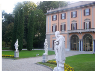
Античные колонны; фото справа – villa Gallia

Поодаль выделяется крупное трёхэтажное строение бежевого цвета, с колоннами. Это и есть Villa Olmo (вилла Ольмо), к которой мы направляемся. Целью пребывания в Сомо является участие в Международной научной конференции , проводимой на вилле Olmo в течение всей недели. Сегодня надо пройти регистрацию и ознакомиться с ежедневным расписанием. Наш отель Park Hotel Meubl   оказался удачно расположен по отношению к месту проведения конференции и ко всей набережной. С другой стороны от отеля находится исторический, старый центр города. Всё в шаговой доступности. Villa Olmo, находящаяся с 1924 года в муниципальной собственности, стала традиционным местом проведения выставок, концертов, конференций и конгрессов.