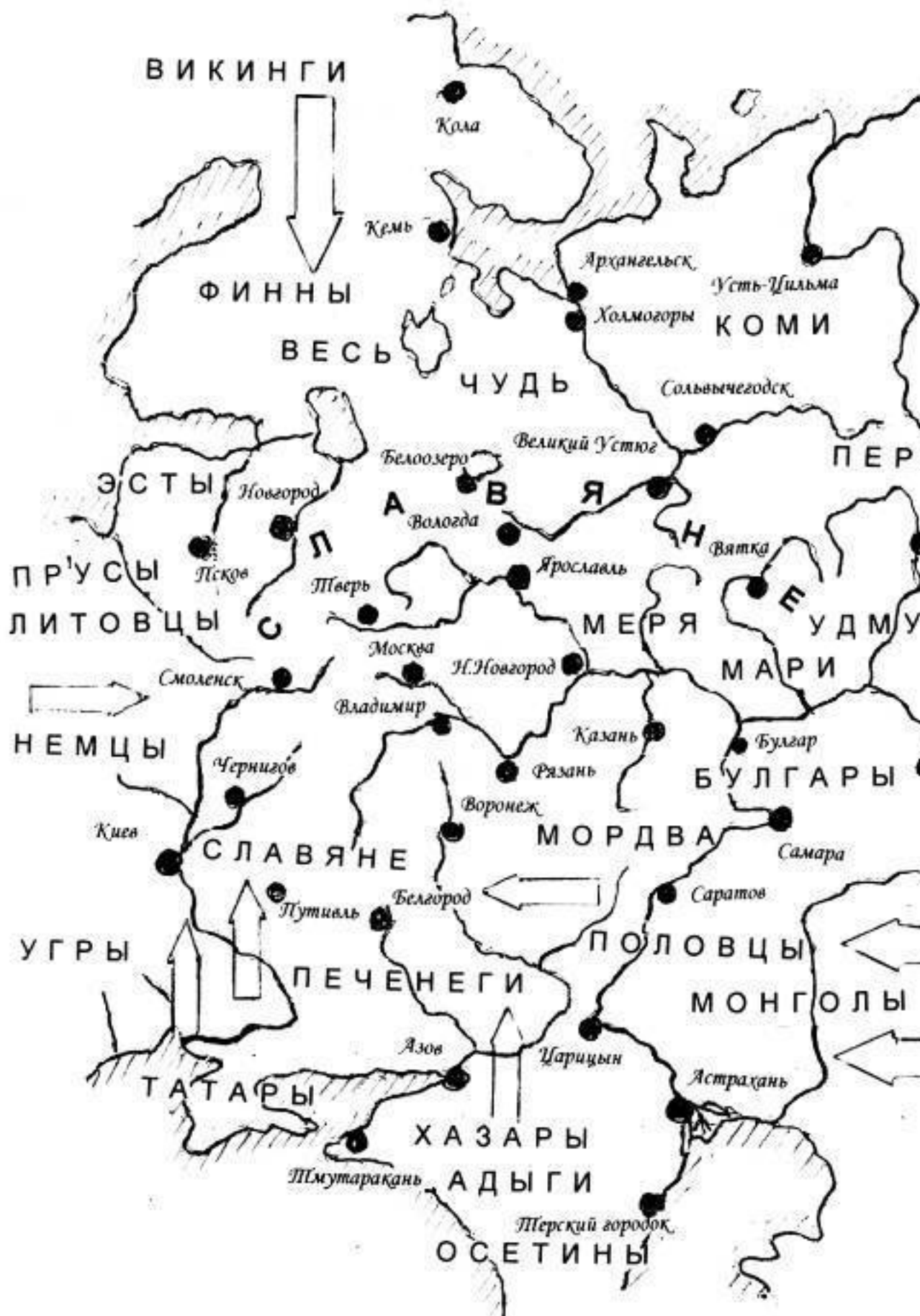
Вятка среди русских городов (14...15) веков