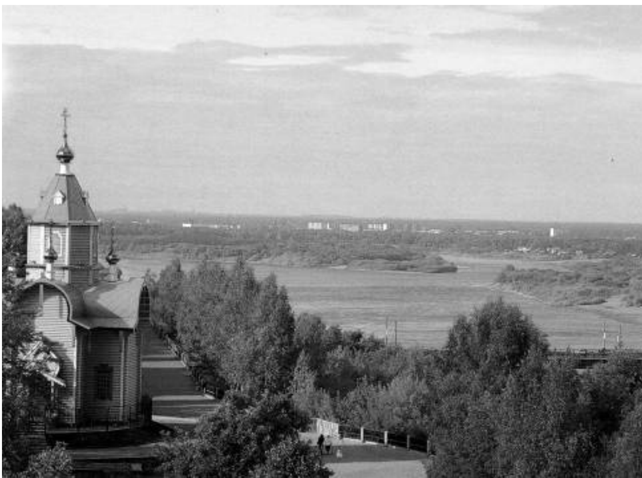
Вид на р. Вятку

С годами ностальгия по Вятке и родным пенатам не ослабевает. Не так давно две девяностолетние бабушки рискнули навестить родное село и побродить по милым сердцу просторам. Когда в окошке вагона замелькали остроконечные елочки, они не смогли сдержать слез.