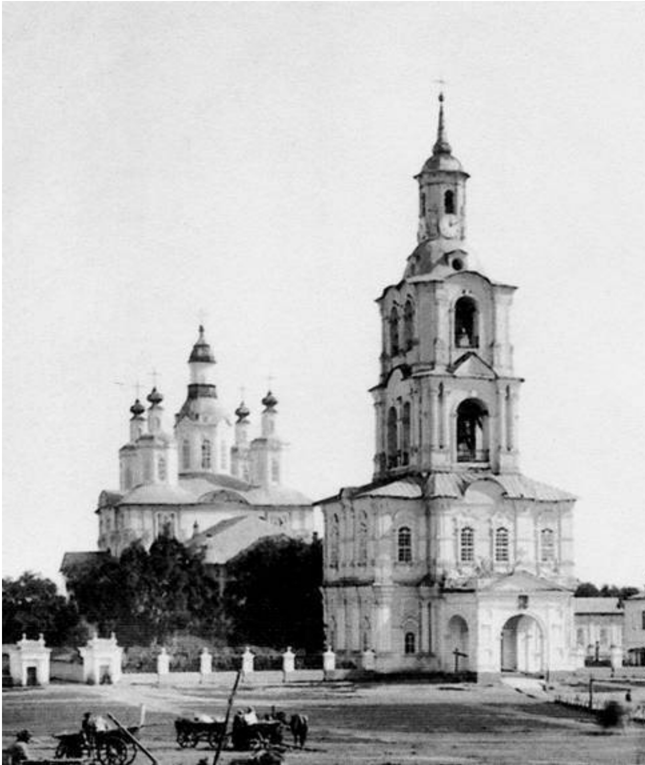
Кафедральный собор XVII век. Разрушен в 1930 г.

Скороговорку вятского говора, изобилующую множеством своеобразных фонетических, морфологических и синтаксических особенностей, трудно понять даже русскому жителю центра России, а для иностранцев просто невозможно