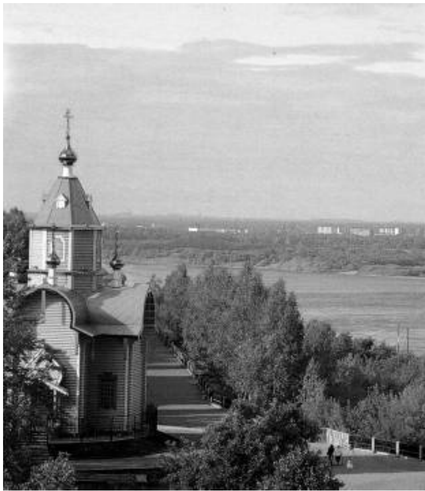
Вид на р. Вятку