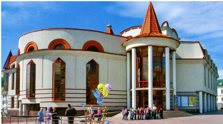
Театр кукол им. А.Н. Афанасьева, арх. В.И. Борцов, 2009 г.