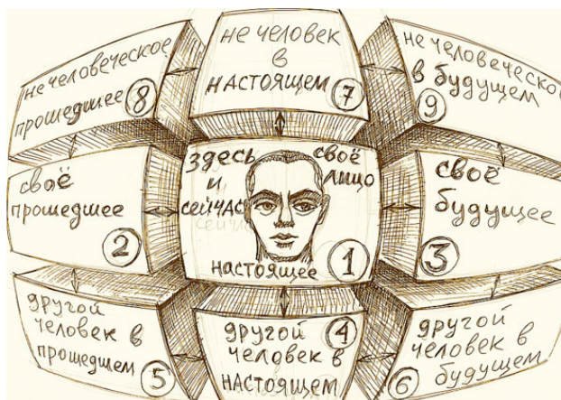
Основная схема темпоральной психологии

Содержание каждой главы важно рассматривать с точки зрения ее приближения или отдаления от лица личности конкретного члена семьи «здесь и сейчас» (центральное изображение на рисунке). По мере отдаления от центральной точки, мы уходим в другие измерения времени и пласты человеческой сущности, что может содержать причины развития или распада.