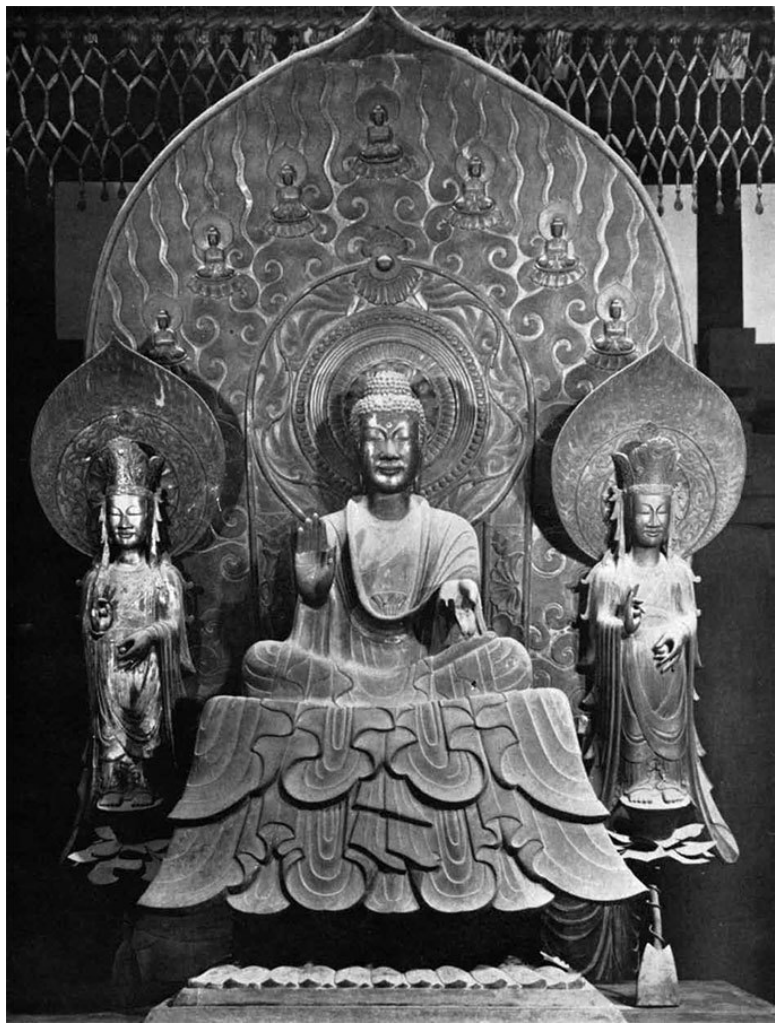
Триада Шакьямуни, бронза, высота центральной фигуры