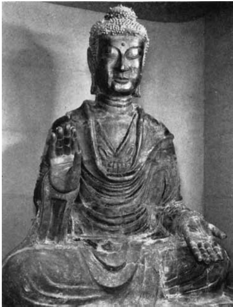
Великий Будда Асука, бронза, 275,7 см, 606 г., храм Анго-