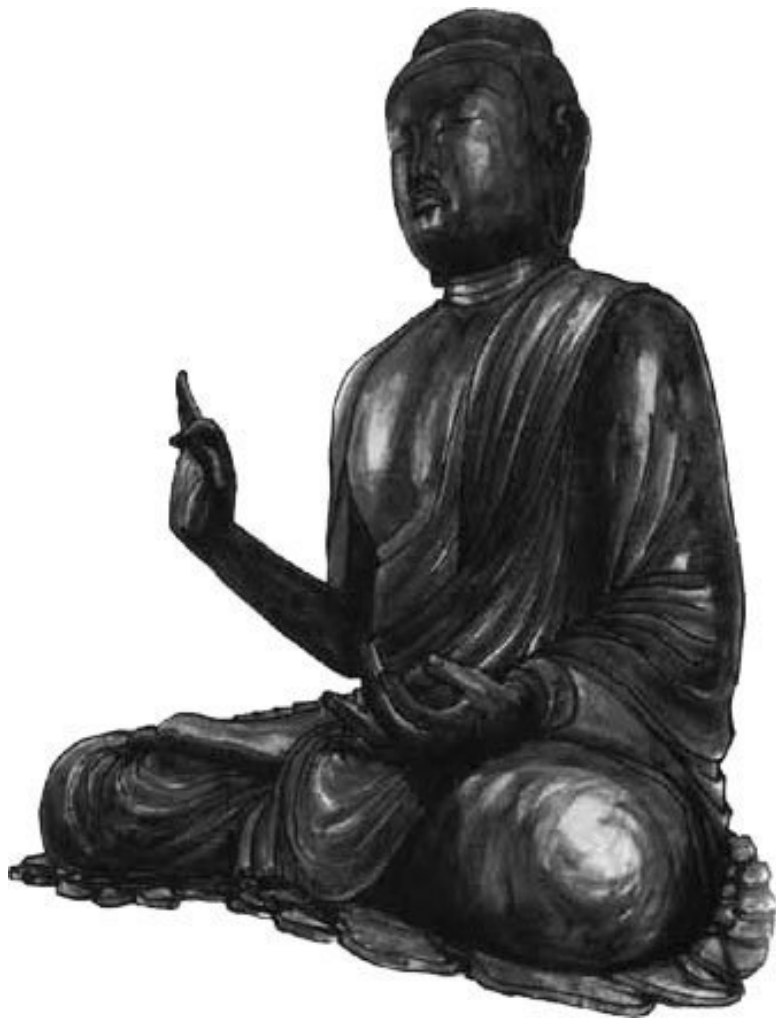
Сидящий Шакьямуни, бронза, 267 см, храм Канимандзи