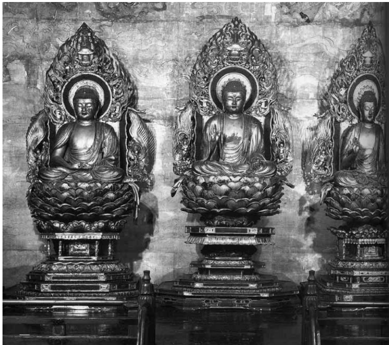
Будды трех миров: прошлого, настоящего и будущего

Особое место в японской пластике отводилось изображению будд нёрай (татхагата) – Так пришедший. Храмовые постройки, в которые помещали скульптуры будд, занимали на территории определенное место в соответствии со сторонами света: храм с буддой грядущего Мироку (пока еще бодхисаттва) Мирокудо располагался на севере, с Амида на западе – Амидадо, с Якуси на востоке – Якусидо и с главным Буд-