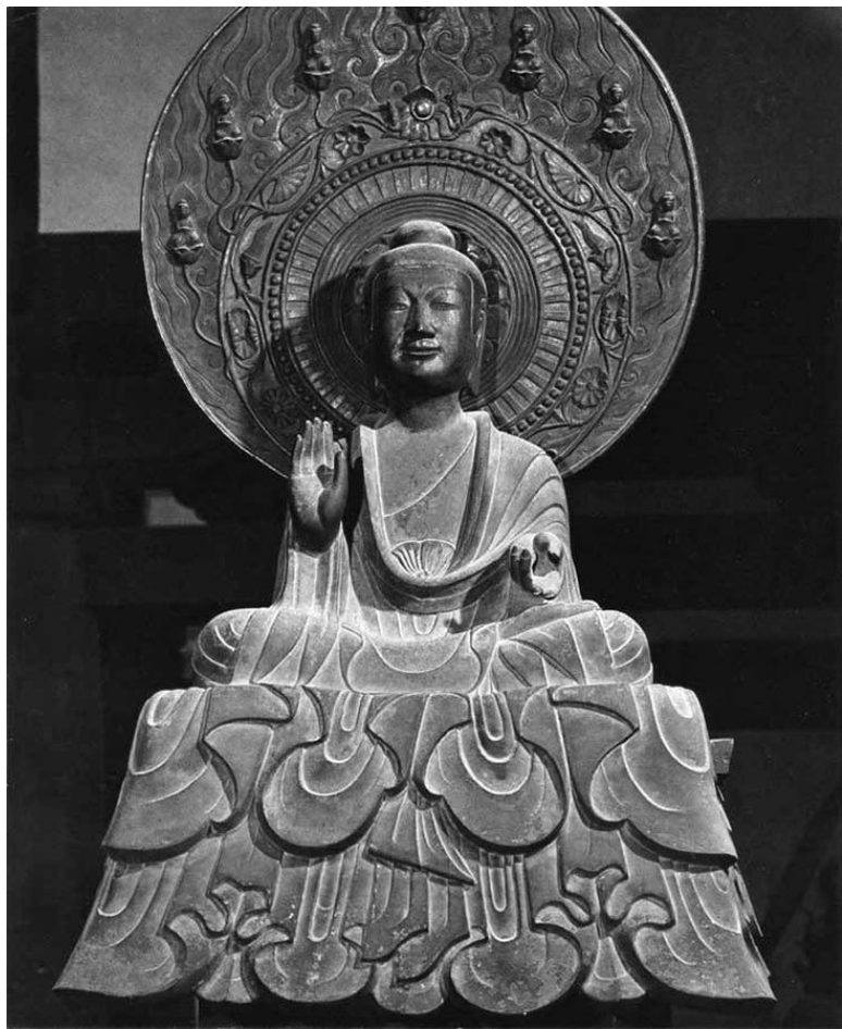
Будда Якуси, бронза, 63 см, втор. пол. VII в., Кондо, храм Хорюдзи, Нара