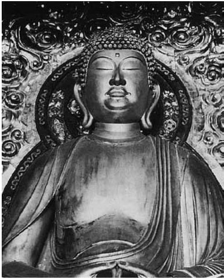
Плечи буддийских божеств