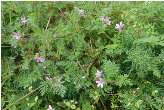
Рис. 1. Аистник обыкновенный (аистник цикутовый, или грабельки, или журавельник цикутовый), лат. Erodium cicutarium/Аистник Манескави, лат. Erodium manescavi