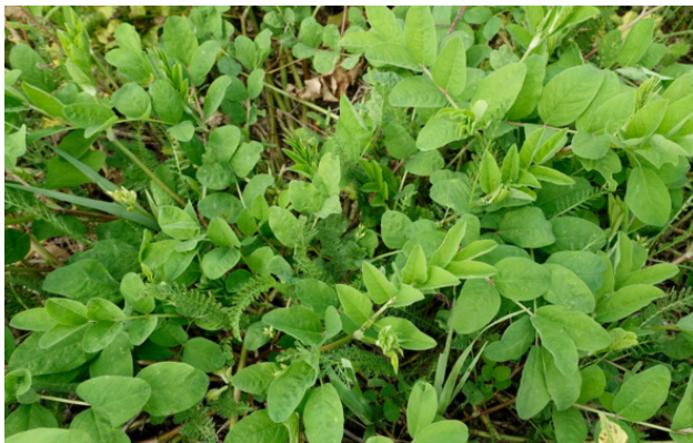
Рис. 3. Астрагал солодколистный (астрагал сладко-