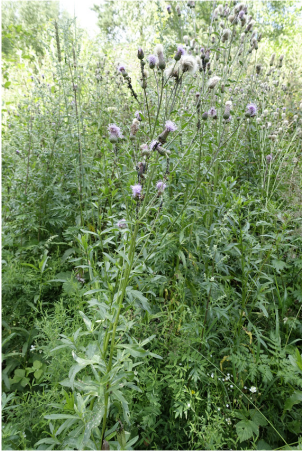
Рис. 15. Бодяк полевой, или розовый осёт, лат. Cirsium arvense