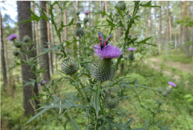
Рис. 13. Бодяк обыкновенный, лат. Cirsium vulgare