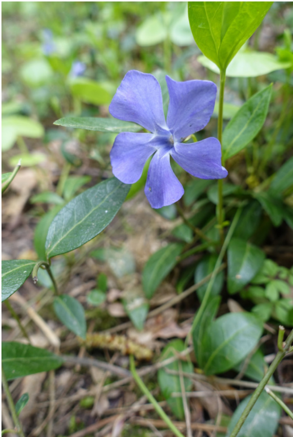
Рис. 7. Барвінок, лат. Vinca