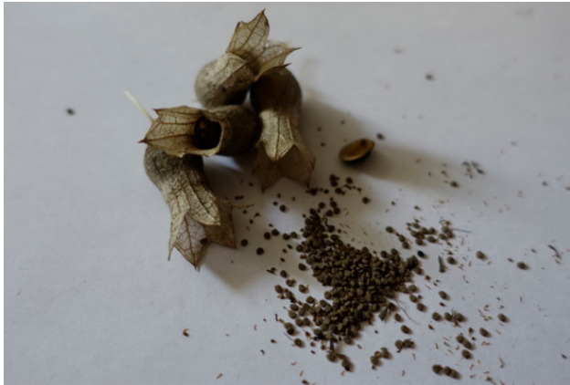
Рис. 11. Беленá чёрная – семена, лат. Hyoscyamus niger