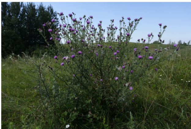
Рис. 12. Бодя́к обыкновенный, лат. Cirsium vulgare