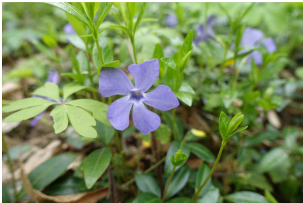
Рис. 6. Барвінок, лат. Vinca