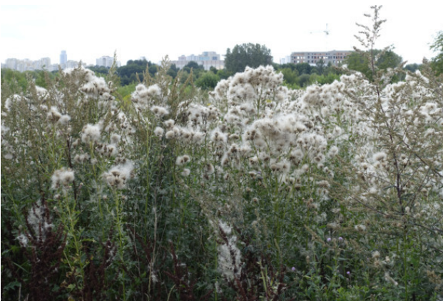
Рис. 14. Бодяк обыкновенный в стадии созревания семян, лат. Cirsium vulgare