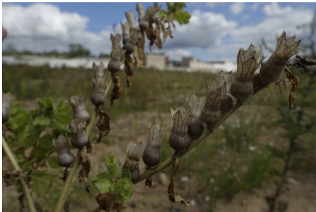
Рис. 10. Беленá чёрная в стадии созревания семян, лат. Hyoscyamus niger