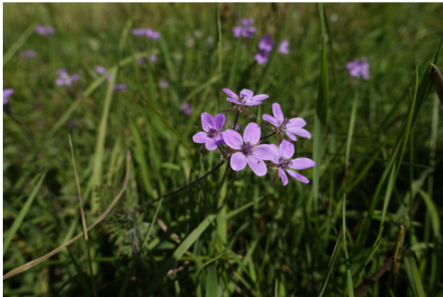
Рис. 2. Аистник обыкновенный (аистник цыкутовый, или грабельки, или журавельник цыкутовый), лат. Erodium cicutarium/Аистник Манескави, лат. Erodium manescavi