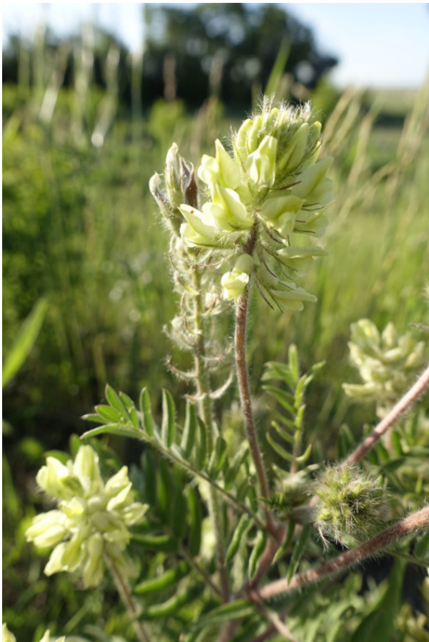
Рис. 5. Астрагал шерстистоцветковый, лат. Astragalus dasyanthus