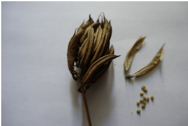
Рис. 4. Астрагáл солодколиственный (астрагал сладко-лиственный) – семена, лат. Astragálus glycyphýllos

лиственный), лат. Astragálus glycyphýllos