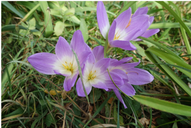
Рис. 8. Безвременник великолепный (дивный моровой шафран), лат. Colchicum speciosum