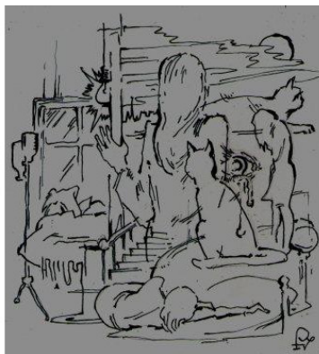
Рис. Александр Пухов

«Кошка абсолютно искренна, человеческие существа по тем или иным причинам могут скрывать свои чувства, но кошка – никогда».