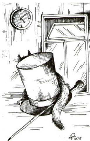
Рис. Александр Пухов

«Если Чеширский Кот улыбается, значит, это кому-нибудь нужно». Льюис Кэрролл