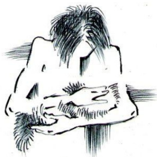
Рис. Александр Пухов

«– Мы с тобой одной крови, ты и я, – ответил Маугли. – Сегодня ты дал мне жизнь».