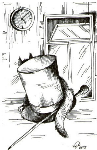
Рис. Александр Пухов

«Если Чеширский Кот улыбается, значит, это кому-нибудь нужно».