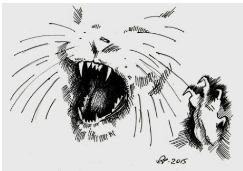
Рис. Александр Пухов

«Львов свирепых сотворил Бог, кровожадных по натуре, а потом возникла кошка – львица, но в миниатюре». Генрих Гейне