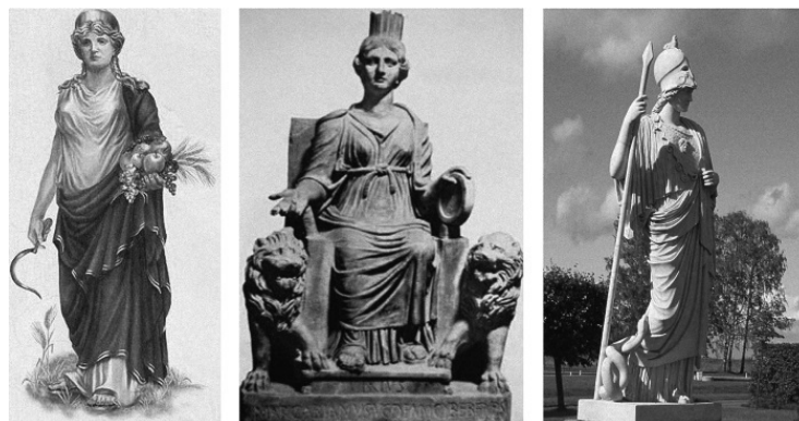
Рис. 6. Богини римской мифологии

В древнегреческой, а затем римской истории наблюдается противостояние и вместе с тем сотрудничество мужчин и женщин, известное нам под видом влияния на исторических деятелей гетер, впоследствии куртизанок, то есть обаятельных, интеллектуально развитых, образованных в духе своего времени женщин, духовно максимально приближенных к мужчинам, влияющих на их жизнь и принимаемые решения, помимо жен. Из последних известна Ксантиппа, сварливая жена Сократа, в противоположность Диотиме из Мантенеи, выступавшей соучастницей встреч, бесед и размышлений Сократа, Платона и иных участников древнегреческих симпозиумов, или гетера Аспазия, ставшая женой полководца Перикла, Фрина, вдохновлявшая Праксителя и Апеллеса, и Тайс Афинская из окружения Александра Македонского (по роману Ефремова). В римской истории наиболее известна своим развратным поведением Мессалина, жена императора Клавдия (рис. 6, 7).