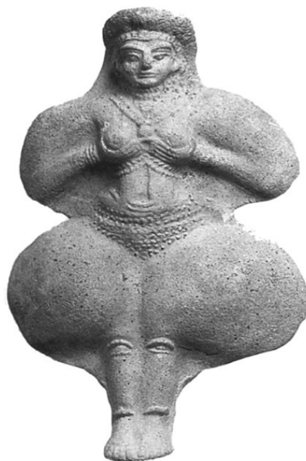
Рис 4. Иштар (Астарта)