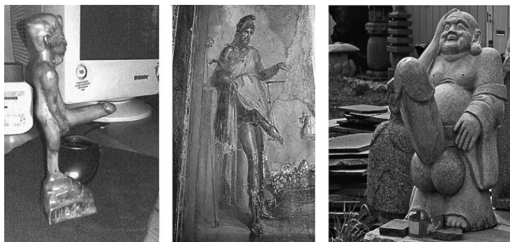
Рис. 2. Боги плодородия: Египет (слева), Древняя Греция (в центре), Япония (справа)

Смена матриархальной семьи патриархальной сопровождалась не только сменой главы рода, но и обособлением пар внутри племени – появлением «частной собственности», права не только на добычу на охоте, но и на желанную представительницу рода. Впрочем, появление семьи, т. е. разделение рода на отдельные образования, остается достаточно темным местом в истории человечества. Однако несомненно, что именно «патриархальная» семья становится доминирующей в последующие тысячелетия человеческой истории.