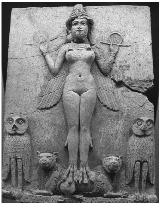
Рис. 5. Изображение вавилонской зооморфной богини с птичьими ногами (Иштар, Астарта, Лилит или Царица ночи), 2025–1750 гг. до и. э.

В древнегреческой, а затем римской истории наблюдается противостояние и вместе с тем сотрудничество мужчин и женщин, известное нам под видом влияния на исторических деятелей гетер, впоследствии куртизанок, то есть обаятельных, интеллектуально развитых, образованных в духе сво-