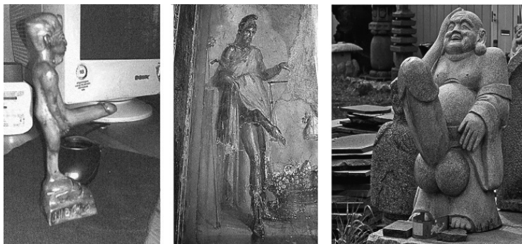
Рис. 2. Боги плодородия: Египет (слева), Древняя Греция (в центре), Япония (справа)

но растительной на мясную пищу, произошло усиление роли мужчин с их большей физической силой и готовностью рисковать здоровьем и жизнью ради добывания пищи и сохранения племени. Тяжелые условия начального существования человечества способствовали возникновению и дальнейшему развитию патриархальной семьи, в которой главенствующая роль женщины, родоначальницы, сменилась ролью отца семейства и патриарха. В археологических находках все чаще встречаются статуэтки богов плодородия (рис. 2).