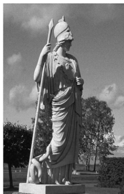
Рис. 6. Богини римской мифологии