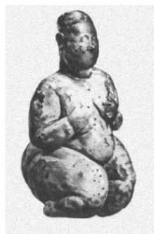
Рис. 1. Статуэтки богинь плодородия

В дальнейшем, в связи с изменением характера питания первобытного человека и переходом с преимуществен-