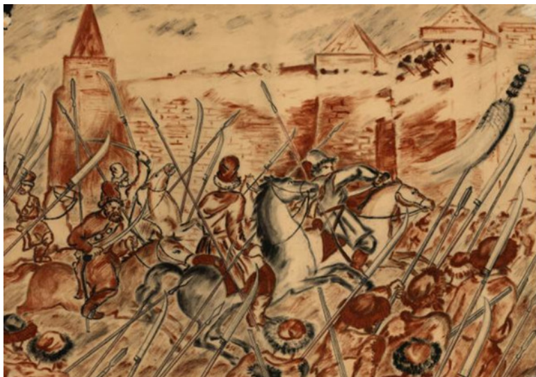
Рисунок 4. Восстание Болотникова. Неизвестный художник

шие начали в городах хватать воевод и сажать их в тюрьмы; крестьяне и холопы начали нападать на господ своих: помещиков-мужчин убивали, жен, дочерей заставляли выходить за себя замуж. В исторической литературе это восстание называют первой крестьянской войной».