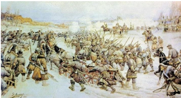
Рисунок 5. Битва войска Болотникова с царской армией (художник Эрнест Лисснер, 1939)

«Видя, что силы Шуйского с каждым часом все увеличиваются, Болотников решил форсировать события. Он пытался взять штурмом Симонов монастырь, но был отброшен с большими потерями, после чего Василий Шуйский перешел от обороны к нападению. Болотников был вынужден уйти из острога. Московские ратные люди преследовали его до деревни Заборья, где верный Лжедмитрию воевода смог снова укрепиться. Однако пало и это укрепление; часть казаков, с атаманом Беззубцевым во главе, перешла на сторону Скопина-Шуйского 21 , начальника москов-