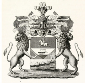
Рисунок 3. Герб рода Болотниковых

«В верхней части щита, в красном поле, находится с подъятым мечем и щитом воин, скачущий в правую сторону на белом коне. В средней части, разрезанной двумя диагональными чертами. в серебряном поле, на золотом лафете черная пушка с сидящею на ней птицею и над нею голу-баго цвета титло, каковое означено в гербе города Вязьмы, а по сторонам, в правом голубом поле согбенная в латах рука с мечем, которая выше локтя разрублена; в левом красном поле, с левой стороны, видна до половины крепость: в нижней части в золотом поле изображена флотилия; шесть судов, одно другого более, означенные диагонально к левому углу, а седьмое у подошвы щита. Над сею флотилиею в правом верхнем углу сияющее солнце. Щит увенчан дворянскими шлемом и короною с строусовыми перьями. Намет на щите голубой и красный, подложенный золотом. Щит держат два льва».