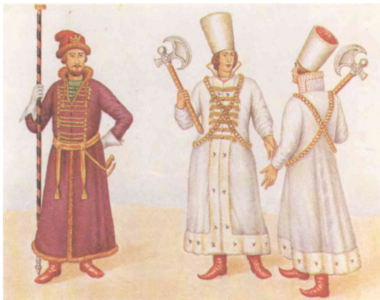
Рисунок 1. Оруженосцы московских великих князей и царей – рынды. Незвестный художник

«...По родословным книгам предок рода Савлук Болотников выехал из Литвы в Россию (1530 г.) при великом князе Василии Ивановиче с сыновьями Федором и Иваном в начале XVI века и жалован был поместьями в Вяземском уез-