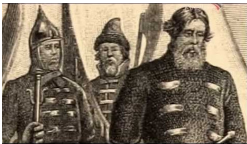
Рисунок 8. Пленный Иван Болотников. Неизвестный художник