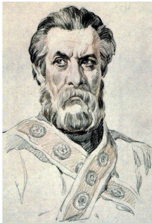
Рисунок 7. Портрет Ивана Болотникова. Неизвестный художник