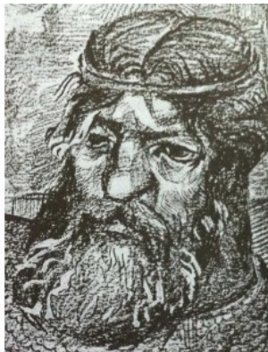
Рисунок 9. Иван Болотников. Неизвестный художник