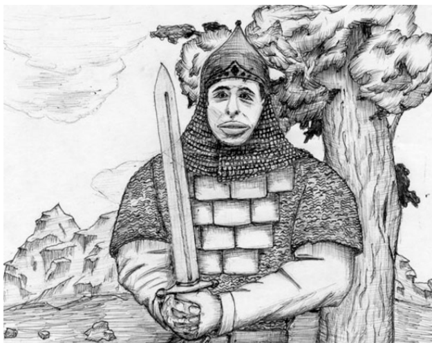
Святомор. Рис. автора