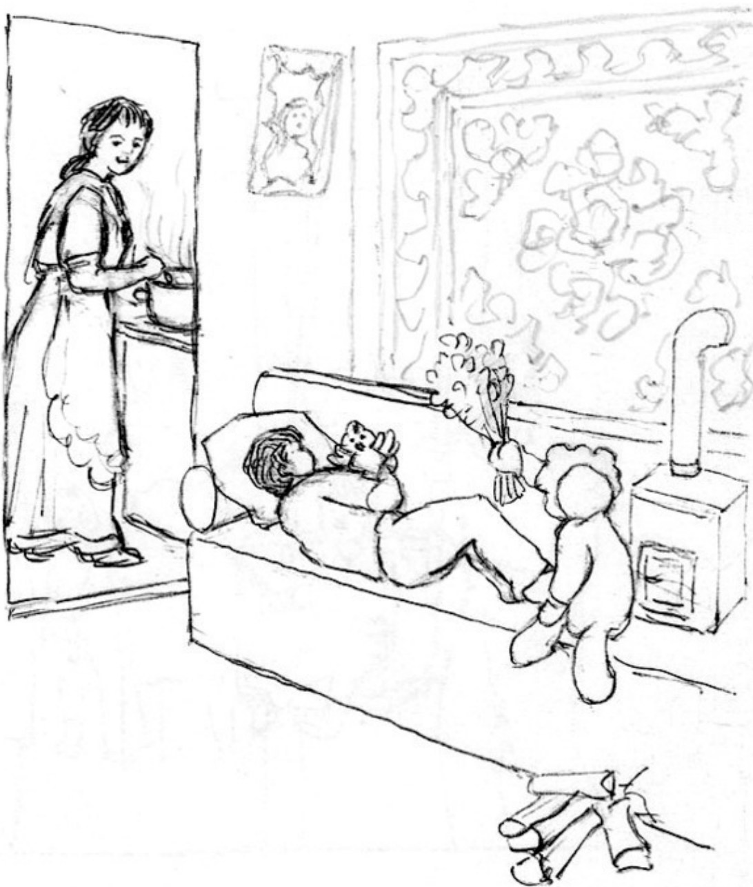
К стих. «Банька».