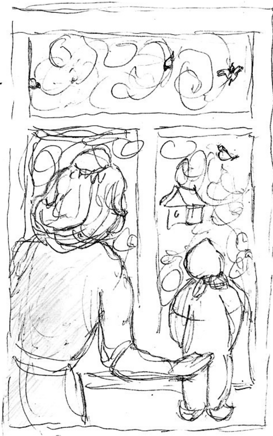
К стих. «Зимняя кузница».