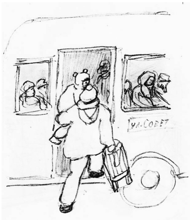
К стих. «Стройка моста».