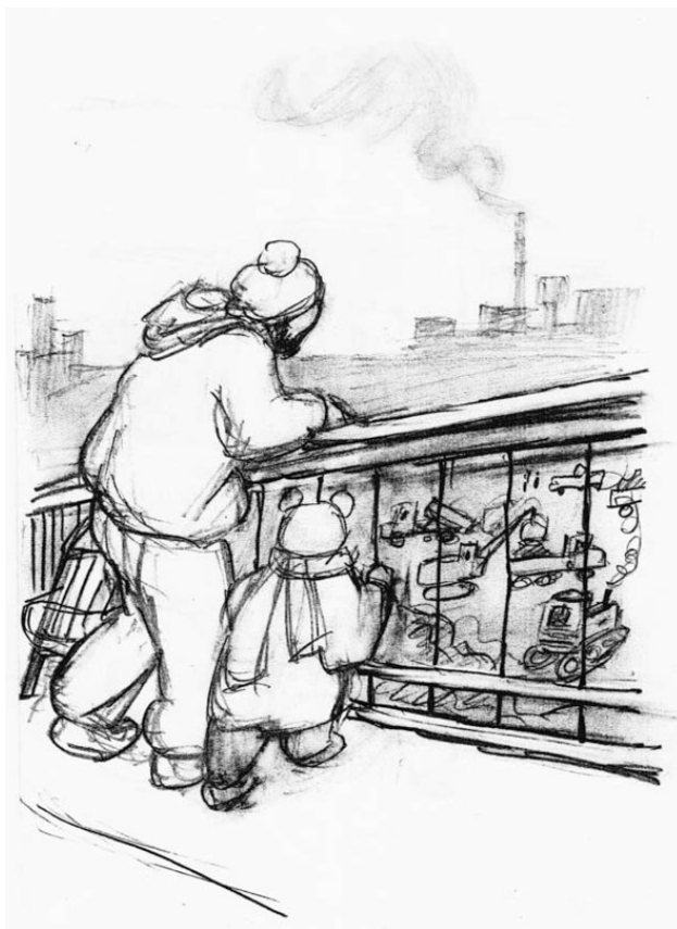
К стих. «Стройка моста».