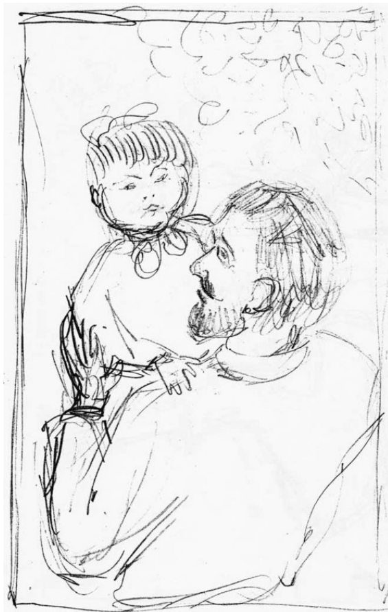
К стих. «Осенняя пастораль».