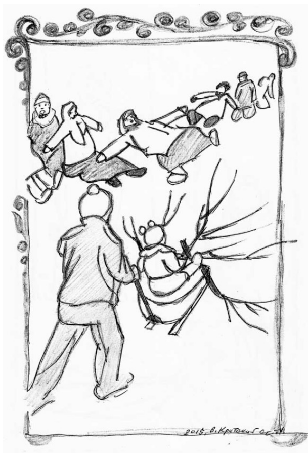
К стих. «Дуня – Илья-Муромец».