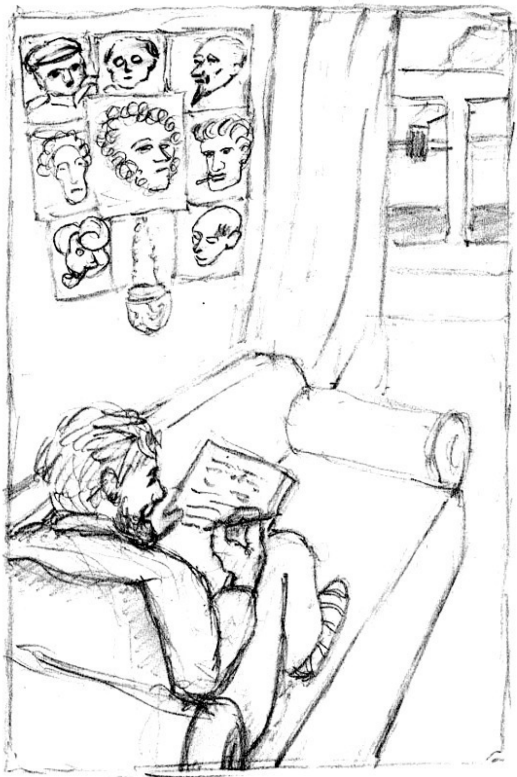
К стих. «Первое вступление».