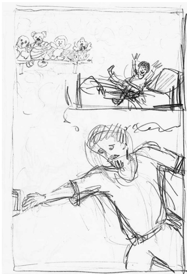
К стих. «Как мы Дуню укладывали спать».