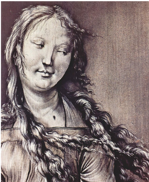
Святая мученица, Маттиас Грюневальд, фрагмент алтарной створки

Еще одним известным образцом абот, выполненных в технике гризайли, является картина Рембрандта «Проповедь Иоанна Крестителя» (1634—1635), находящаяся в коллек-