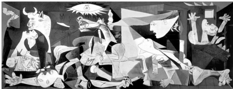
«Герника» П. Пикассо (Guernica) (1937)

Пабло Пикассо в картине «Герника» также использовал технику гризайли.