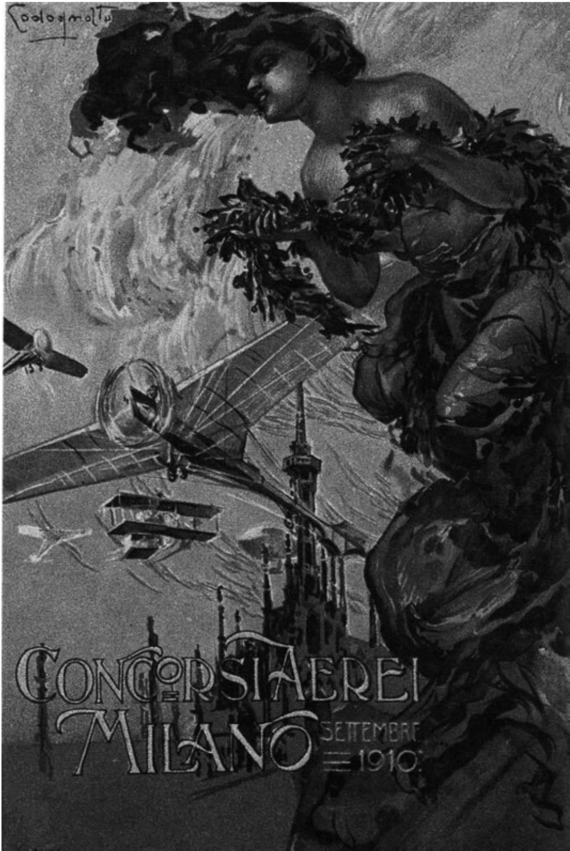
Плинио Кодоньято. Открытка для первого международного авиашоу Милане (1910)

Отказ от линейного времени, несмотря на неизменное воспевание прогресса (еще одна антиномия футуризма), связан, с одной стороны, с идеей обновления и возрождения культуры через ее «варваризацию», через обращение к мифологическому архаическому времени