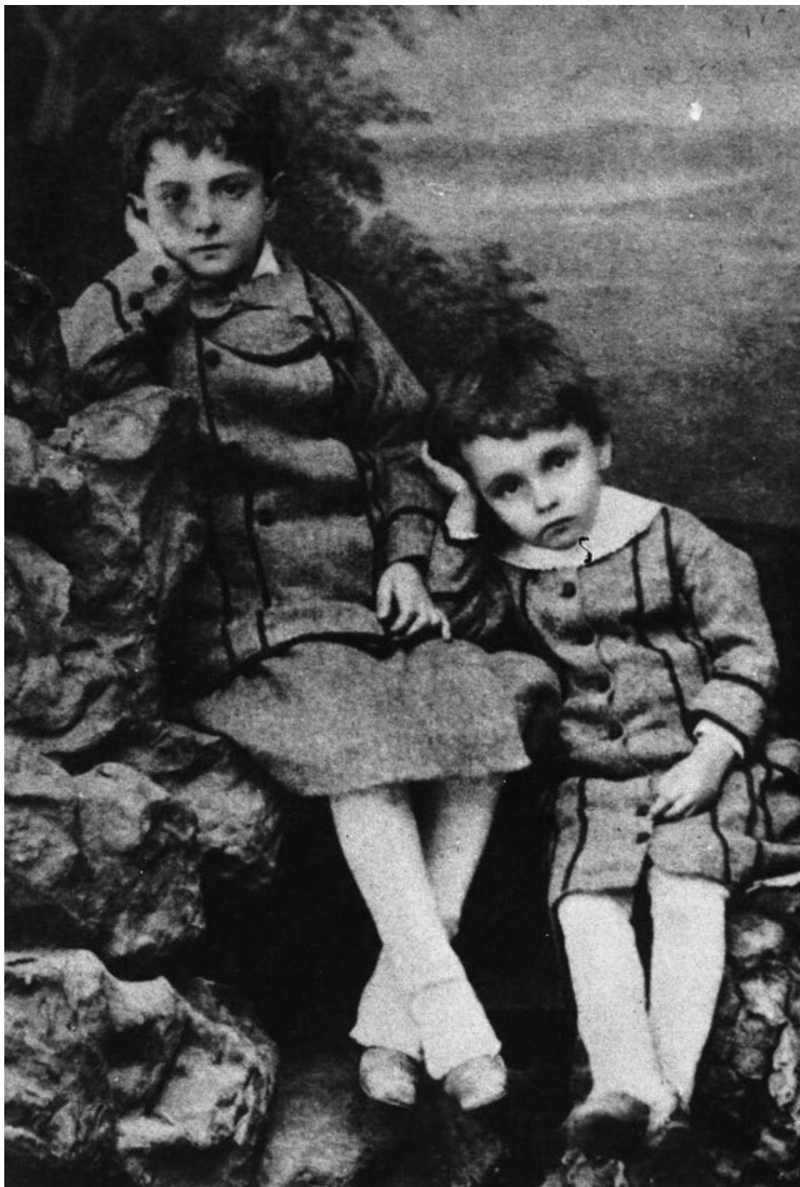
Маринетти и его старший брат Леон (ок. 1881)