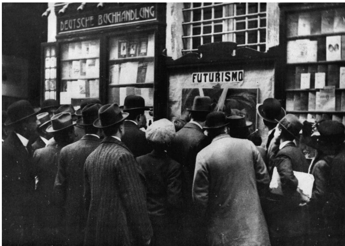
Толпа возле футуристических афиш. Берлин (1913)

гие исследователи, разворачивается в Египте – некоторые описания пейзажей и архитектуры указывают на конкретные места ландшафта и известные сооружения Александрии. Маринетти с упоением повествует о властных амбициях короля Мафарки, превращая его в африканский парафраз Александра Великого или Наполеона. Конечно, к этой апологии власти и военных триумфов в значительной степени добавлены колониальные надежды и имперские фантазии культурной и политической элиты Италии начала XX века.