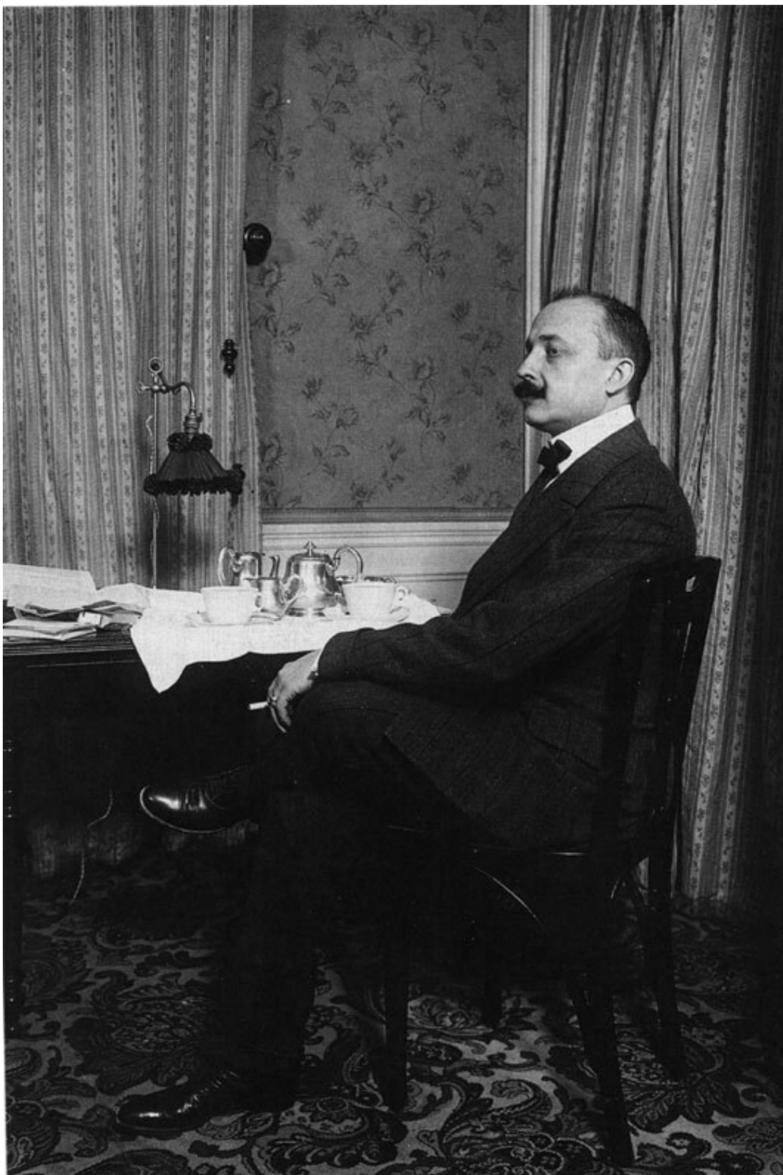
Маринетти в Париже (1909)