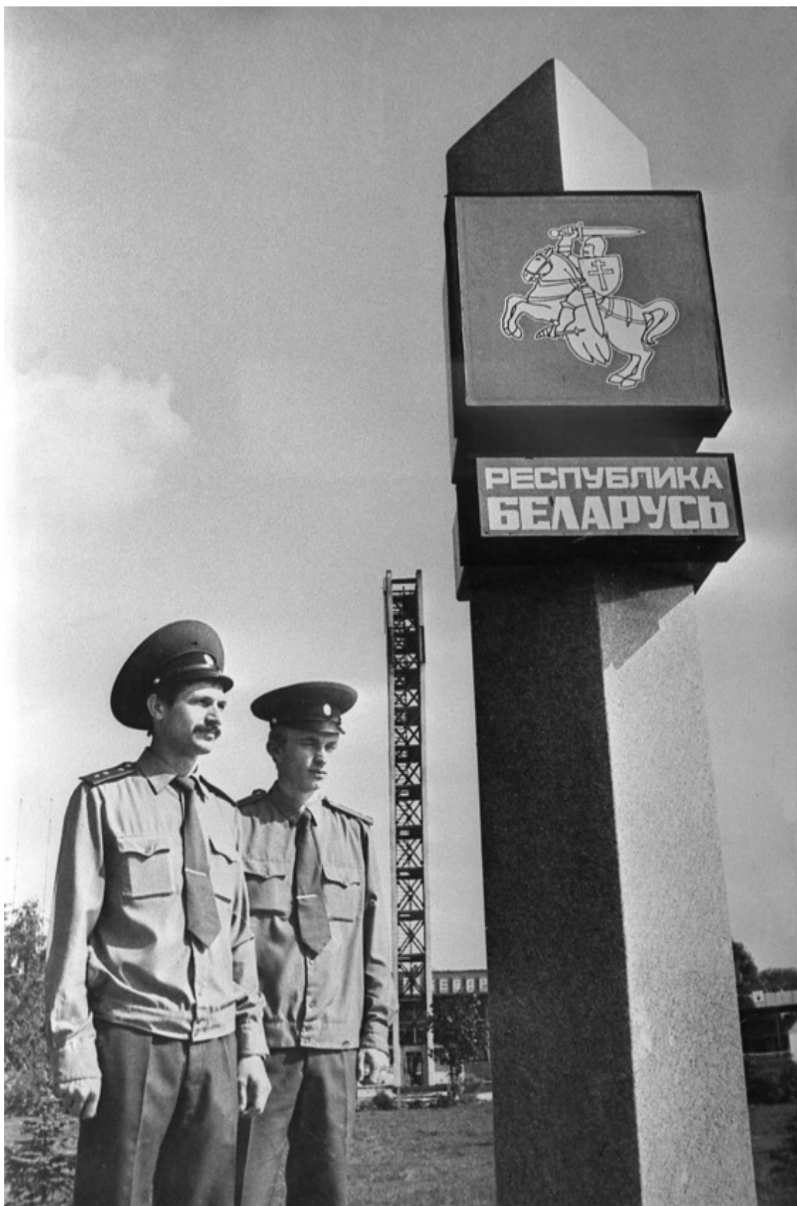
Договором о добрососедстве и дружелюбном сотрудничестве, заключенном между Беларусью и Польшей в Варшаве 23 июня 1992 г. и вступившем в силу 30 марта 1993 г., стороны