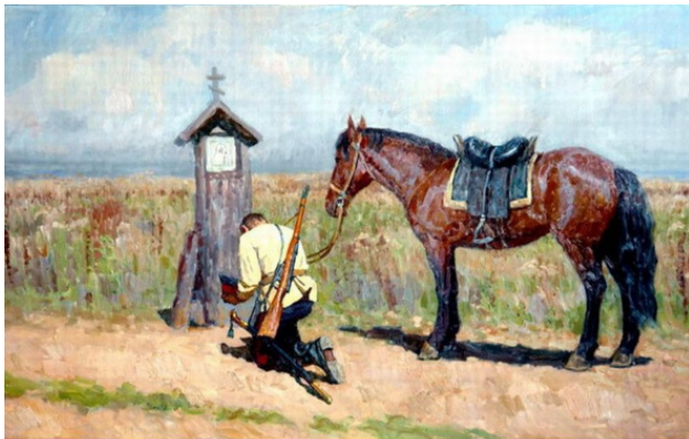
Картина, - казак молится после большой сечи

После сечи той большой... Казак молится родной, Что пуля врага его обошла И копье не достала его плеча! Он много врага в бою порубил, Много чужих... он душ сгубил. Просит, чтоб Бог его простил... Грешную душу в живых сохранил. В следующем бою его уберёт... Голову на плечах его сберёт.