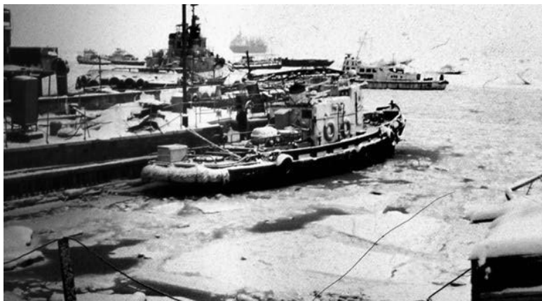
Катер «Вуквол».

О выходе в море нечего было и думать: портнадзор явно не позволит выйти дальше акватории порта, если даже упрашивать дежурного, стоя на коленях, тридцать с лишним метров в секунду – не шутка. До окончания экспедиционных работ оставалось немногим более полумесяца. Это катастрофически мало, если учесть, что почти столько же времени, отведённого на исследование Чаунской губы, уже потрачено. Шеф, для которого безделье, даже вынужденное, всегда ассоциировалось с концом света, был мрачен. Он перестал воспринимать шутки и, то и дело, спрашивал у кого-нибудь из нас: