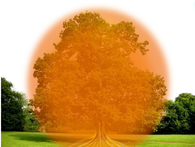
Рис. 1. Энергетический кокон Дуба.

Дуб является одним из проводников Духа Вездесущего. Он связан со слоем мира Духа, который окутывает нашу планету. Этот слой мистики часто называют Акаши. Вокруг