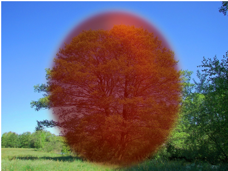
Рис.3. Энергококкон Ольхи.