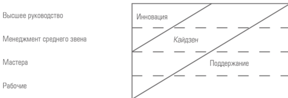
Рис. 1-2. Место инновации и кайдзен в процессе совершенствования

Как показано на рис. 1–2, совершенствование может классифицироваться как кайдзен или как «инновация».