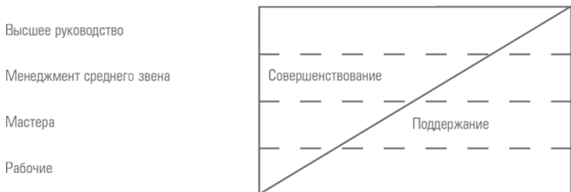
Рис. 1-1. Японское восприятие должностных функций

В контексте кайдзен у менеджмента есть две главных функции: поддержание и совершенствование (См. рис. 1–1). Поддержание – это действия, направленные на обеспечение имеющихся технологических, организационных и операционных стандартов, и поддержку таких стандартов за счет обучения и дисциплины. В рамках функции поддержания менеджмент исполняет свои задачи таким образом, чтобы каждый мог следовать требованиям стандартных рабочих процедур ( standard operating procedure, SOP ). Совершенствование же – это все, что направлено на улучшение существующих стандартов. Японское представление о менеджменте, таким образом, сводится к одному предписанию: поддерживайте и улучшайте стандарты.