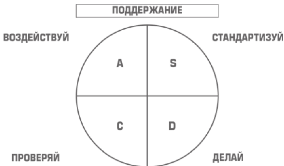
Рис. 1-4. Цикл «стандартизуй-делай-проверяй-воздействуй» (SDCA)

Планируй предполагает, что должны быть установлены цели для совершенствования (так как кайдзен – стиль жизни, то всегда должна быть цель совершенствования в любой сфере) и намечены планы действий для их достижения. Делай относится к реализации плана. Проверяй относится к определению того, оставило ли внедрение след и привело ли к запланированному улучшению. Воздействуй относится к построению и стандартизации новых процедур, призванных предотвратить повторение первоначальной проблемы или установить цели для новых улучшений. Цикл PDCA постоянно возобновляется: как только происходит улучшение, результат процесса превращается в объект дальнейшего совершенствования. Внедрение PDCA означает: «никогда не удовлетворяться существующим положением вещей». Поскольку люди предпочитают сохранять статус-кво и зачастую уклоняются от инициирования улучшений, менеджмент должен подталкивать их, постоянно устанавливая стимулирующие цели.