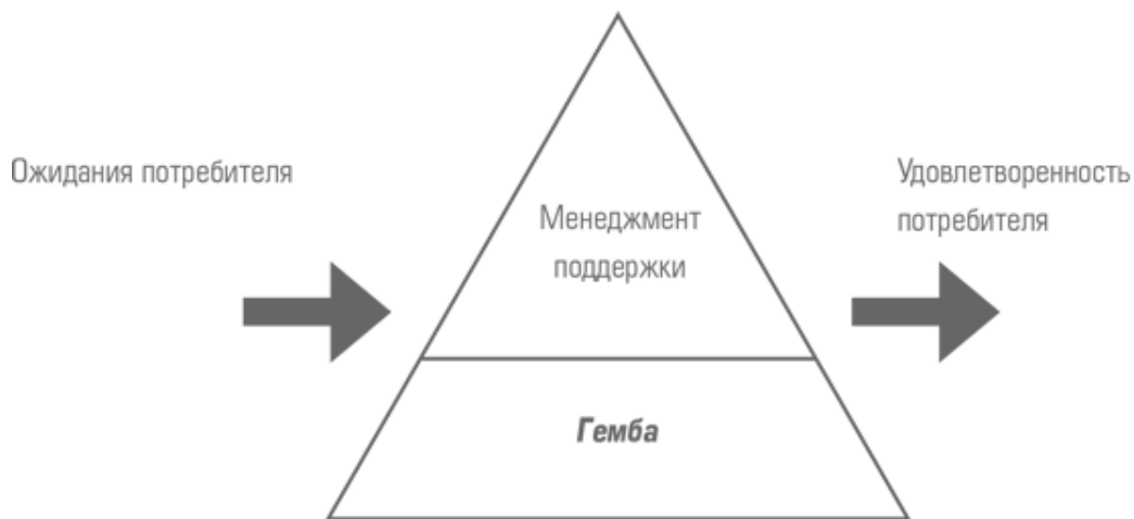
Рис. 2-2. При таком взгляде на отношения гемба – менеджмент роль менеджмента заключается в управлении политикой и ресурсами в гемба

Этот подход резко контрастирует с представлением о гемба (рис. 2–2) как о месте, где всегда все делается не так, как надо, и как об источнике ошибок и претензий потребителя. В Японии о работе, связанной с производством, иногда говорят: три «К», что можно расшифровать с помощью трех японских слов: «опасная» ( kiken ), «грязная» ( kitanai ) и «напряженная» ( kitsui ). Когда-то гемба была местом, которого избегали хорошие менеджеры, поэтому назначение на должность в гемба означало, что на карьере можно поставить крест. Сегодня, напротив, у президентов ряда известных японских компаний есть богатый опыт в области гемба . Они обладают хорошим пониманием того, что там происходит, а также обеспечивают ей соответствующую поддержку.