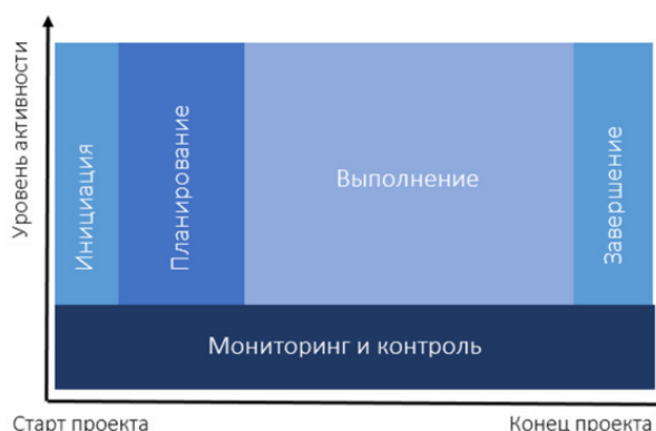
Рисунок 3. Фазы жизненного цикла проекта.

В связи с тем, что проект развивается во времени и его состояние изменяется, для удобства определения состояния проекта, для контроля за ходом выполнения проекта принято разбивать продолжительность проекта на отдельные отрезки, называемые фазами (этапами) жизненного цикла проекта (Рис.3).