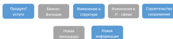
Рисунок 2. Возможные исходы реализации проекта.

Возможные исходы реализации проектной деятельности представлены на Рис.2.