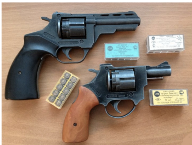
Газовые револьверы «Айсберг» RG-205 и RG-207

Приобрести газовый пистолет или револьвер может любой гражданин России, достигший 18 лет (ФЗ №150 ст. 13), после получения лицензии на его приобретение в органах внутренних дел по месту жительства.