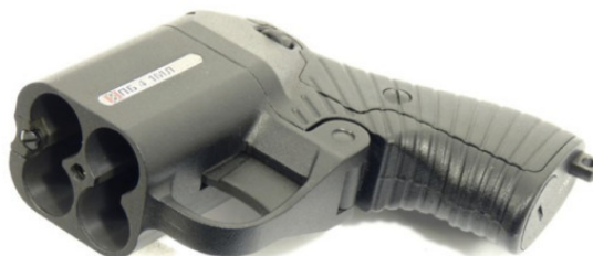
Бесствольный пистолет «Оса» ПБ-4