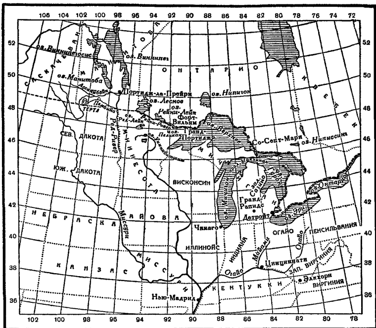
Район, в котором жил Теннер, находясь среди индейцев (в более крупном масштабе).