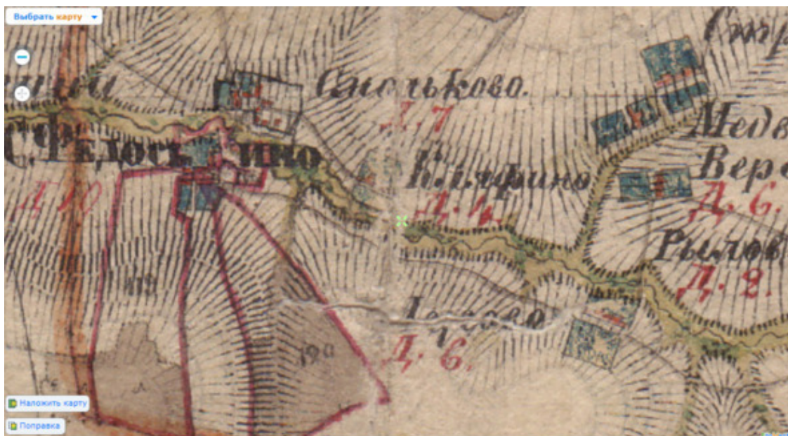
Смольково на карте Менде 1850 год

От названия села Смольково получила свое название и волость. Село Смольки (бывшее Федосьино) славилось церковной архитектурой. Разрушения в 1950-х годах церковь Илии Пророка в селе Смольки, с фасадов этой церкви «вся Россия-матушка брала пример для строительства церквей». 19 декабря 1857 г. по приказанию министра М. Н. Муравьева управляющий Нижегородской удельной конторы В. И. Даль отправил проект и смету, по которым была построена каменная церковь в селе Федосьине Балахнинского уезда. Местные жители поставили поклонный крест там, где был вход в церковь.