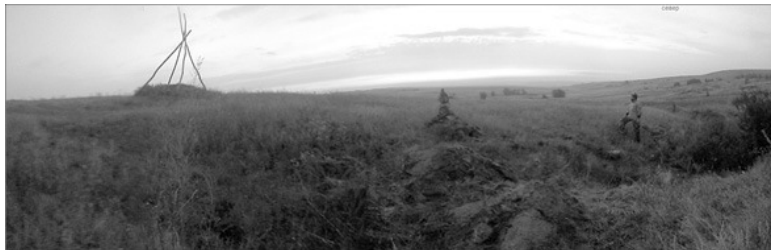
Медведицкая гряда. Панорама степи

раж? Такой, о которых мне приходилось только читать, образно назвал бы их миражами из Прошлого или хрономиражами! А может, я просто заблудился тогда и случайно или «с чьей-то помощью» попал в какую-то иную деревню? Тоже маловероятно. Одно дело – объяснять, что видели другие, другое дело – понять и поверить в то, что видел сам. Не знаю, не знаю... История эта закончилась ровно ничем.