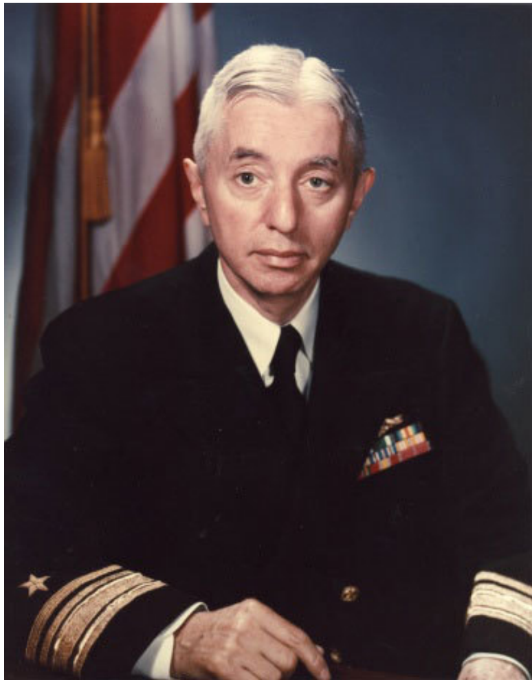
Создатель американского атомного подводного