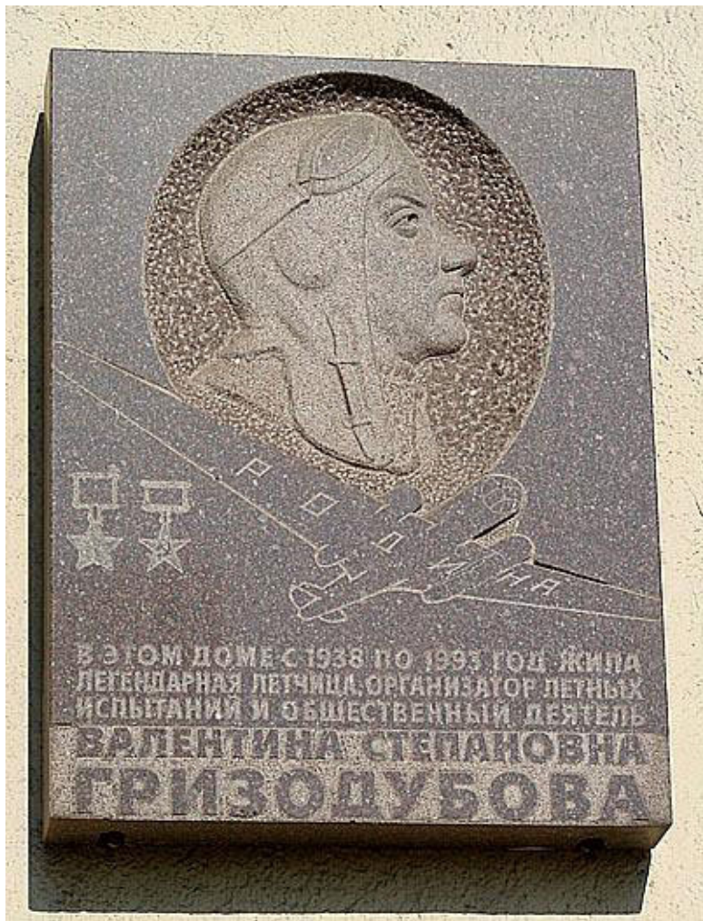
Памятная доска на доме Академии Жуковского, где