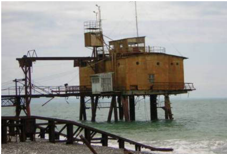
Морской павильон для акустических измерений