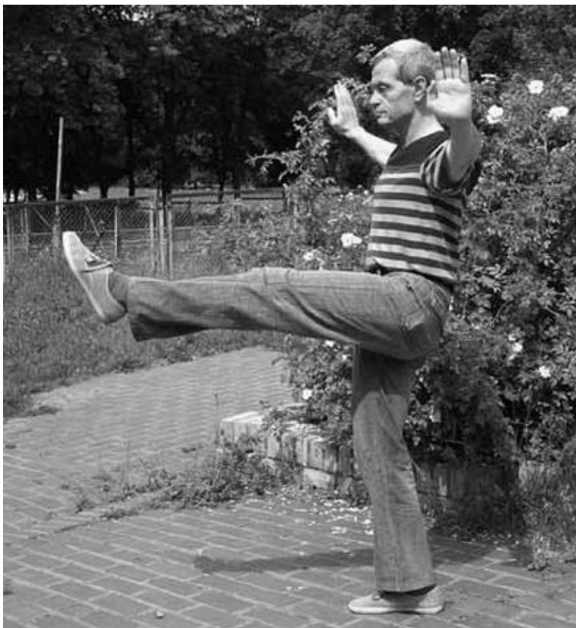
Подъем ноги вперед (вид сбоку)

Затем провести ногой по кругу влево, через сторону назад.