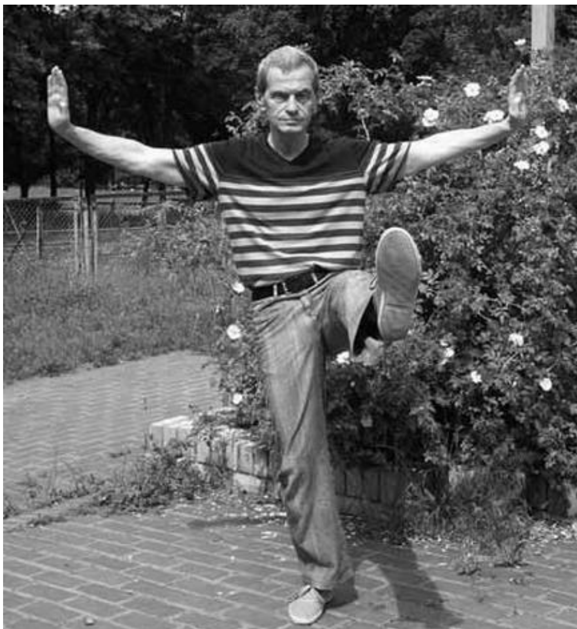
Подъем ноги вперед (вид спереди)