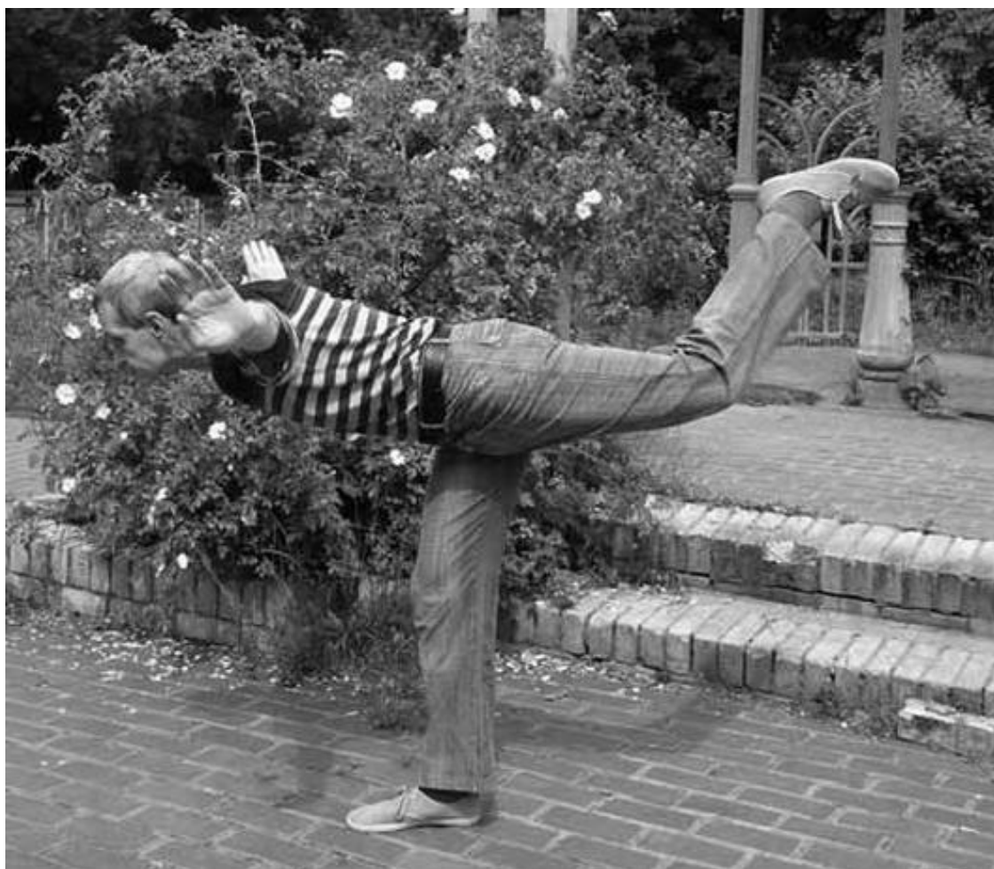
«Наклонное стояние» на одной ноге (вид сбоку)

Такое же движение проделать правой ногой.