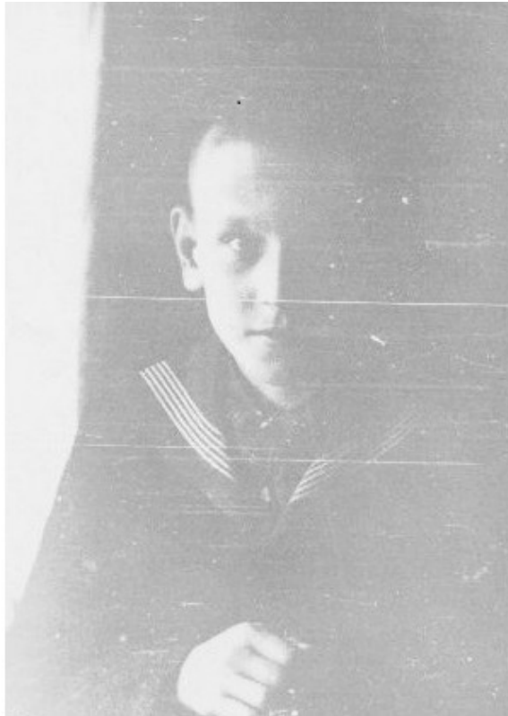
Год 1956. Последние дни в Заборье

Все было просто замечательно, пока Хрущев не объявил набор инициативных людей с производства, для руководства колхозами. Наборов было несколько. Отец попал в «десяти-тысячники». В отличие от Давыдова, он был родом из деревни, и в сельском хозяйстве что-то понимал. Первую четверть шестого класса я отучился в Заборье, вторую начал уже в Воскресенском.