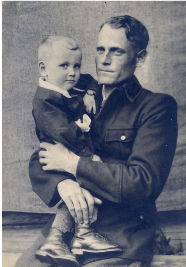
Я с отцом. Примерно три года. Показать часы нужно было обязательно. Достаток. Со взглядом, наверно, что-то делали.