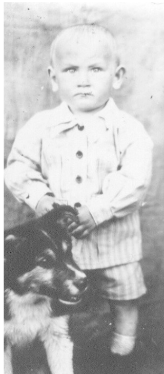
Примерно 47 год, с Тобиком.