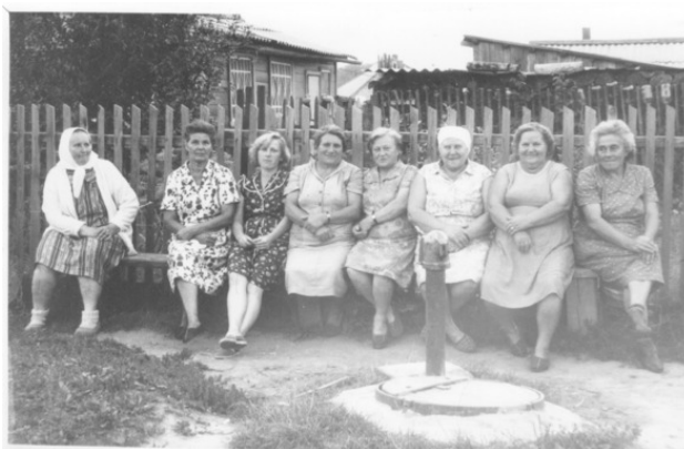
Поселок Островское, улица Комсомольская и ее обитательницы.

Главное, первые впечатления о школе. Тогда проблем с демографией не было, и набралось два восьмых класса. Школа представляла собой двухэтажное, кирпичное внизу и деревянное наверху, здание еще дореволюционной постройки. Чистое и аккуратное.