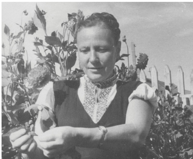
Мама со своими георгинами. После переезда в Островское. Счастье.

Второй случай почти такой же. У нас была кошка. К ней, естественно, ходили коты. Они же, естественно, орали. Все это происходило на чердаке. Один раз у меня лопнуло терпение и я, взяв винтовку, полез на чердак. Они разбежались. Я выстрелил, но не попал. Как оказалось, это я в кота не попал. А попал в окно соседского дома. Пуля, пробив наружное стекло, застряла на втором. Пуля замедлилась фронтоном дома, который она пробила. Опять ангел-хранитель.