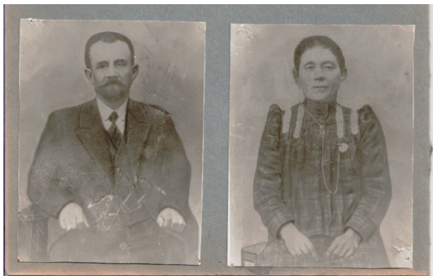
Прадед и прабабушка по отцовской линии.