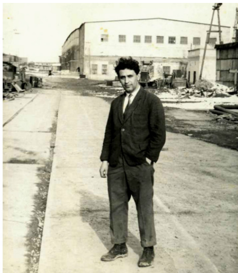
Гигант строительной индустрии Красноярский комбинат железобетонных и металлических конструкций, 1964 год.

Из прошлой практики я знал, что состав работников ремонтно-механических цехов отличается высоким профессионализмом, наличием творческого мышления и завоевать у них признание своей профпригодности дело не простое. Поэтому для меня эта задача представлялась наиболее важной. Я понимал, что коллеги по работе от мастеров до руководства цехом, а так же заказчики, с которыми приходилось согласовывать особенности исполнения каждого заказа, работники некоторых профильных служб заводоуправления некоторое время будут также присматриваться, и изучать меня. В конце концов, мы все притёрлись друг к другу, и я почувствовал себя в новой среде «как в своей тарелке» .