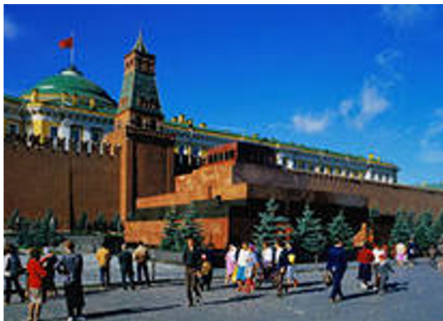
Гости Москвы на красной площади

В Москве в то время проходил какой-то международный форум, на который съехались многочисленные делегации из разных стран. Попав впервые в столицу, мы, конечно, постарались максимально использовать представившуюся возможность познакомиться с её достопримечательностями, и постараться побывать в святынях для советских людей того времени местах, среди которых особое место занимали мавзолей В. И. Ленина и Красная площадь. Мы остановились в Москве, у родственников наших красноярских друзей, с которыми была достигнута предварительная договорённость.