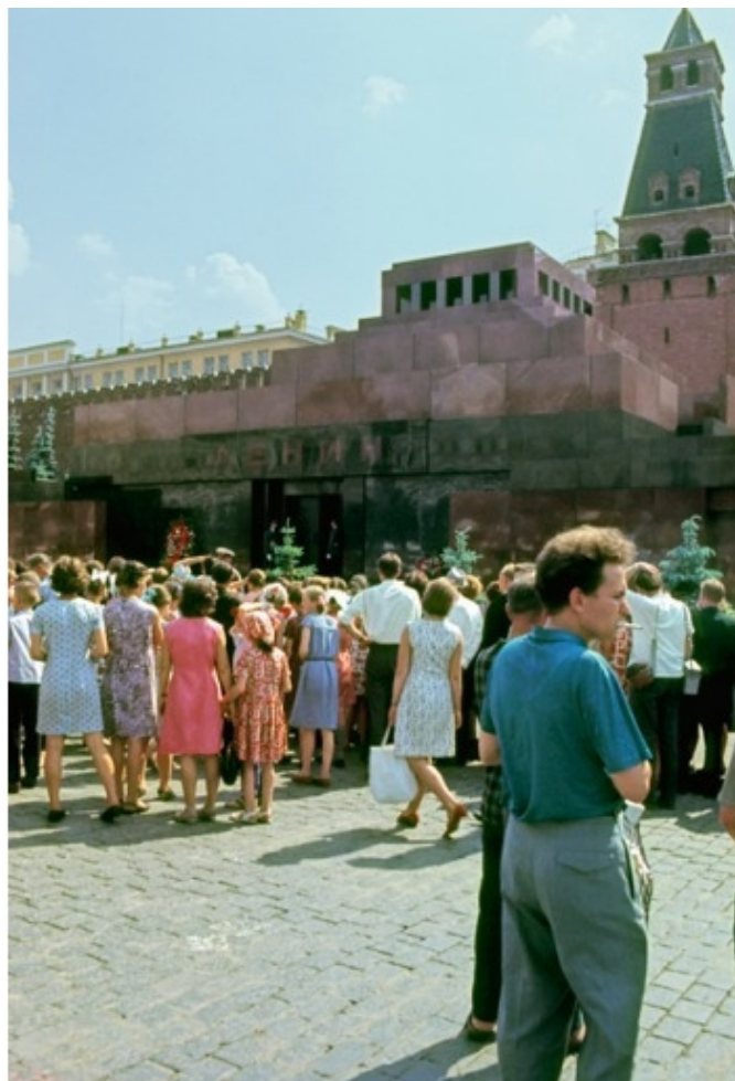
Очередь желающих посетить мавзолей В. И. Ленина