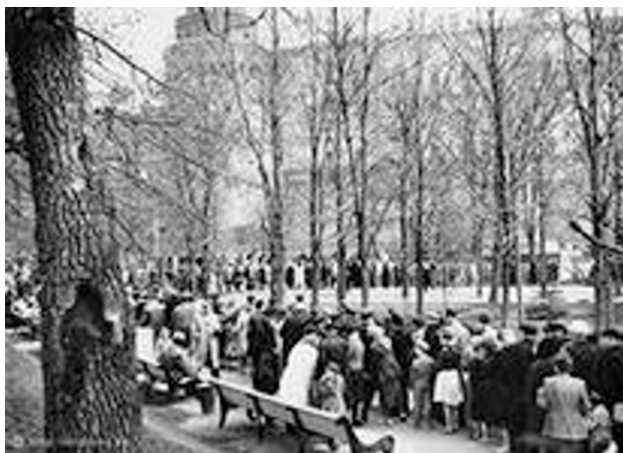
Москва, Александровский сад, отсюда начинался путь к мавзолею В. И. Ленина, 1962 год

варианты преодоления его. Через имеющиеся проходы пройти было невозможно, они были закрыты и снаружи, кругом была охрана. Внутри сада вдоль высокого забора из кованых прутьев через каждые 20—30 метров стояли милиционеры и внимательно следили за порядком.