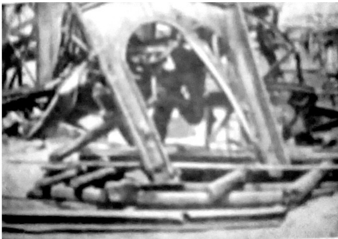
Шурф шахты №5, где фашисты казнили молодогвардейцев

восприятия жизни заменила, и мать и отца и всех других и ничего другого ожидать и требовать было бессмысленно. Бабушка тоже к нему была очень привязана и не представляла, как с ним расстанется. Наверное, не только это было причиной её уговоров нас оставить ребёнка ещё на год у неё. Она была умной и дальновидной женщиной и сознавала, что мы ещё ни материально и не морально не были готовы полностью взять на себя ответственность за ребёнка, хотя мы сами этого не сознавали и противились уговорам. Но, в конце концов, она нас убедила, и мы согласились. Ну а пока мы старались завоевать его расположение к нам, уделяя ему много внимания.