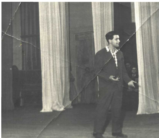
Моё выступление в концерте художественной самодетельности ЛДК, 1962 год

Кроме этого, обладая приличным репертуаром произведений, читаемых мною в прошлом со сцены я продолжил своё художественное творчество и в этой сфере. Заметив, что я обладаю приличной дикцией и голосовыми данными, меня использовали и в качестве конферансье, или как теперь принято говорить – ведущего программы. Мне на всю жизнь запомнилась эти незабываемые праздничные ощущения от зрительской оценки твоего творческого труда, концертные поездки и выступления в разных творческих коллективах и участие в смотрах художественной самодетельности.