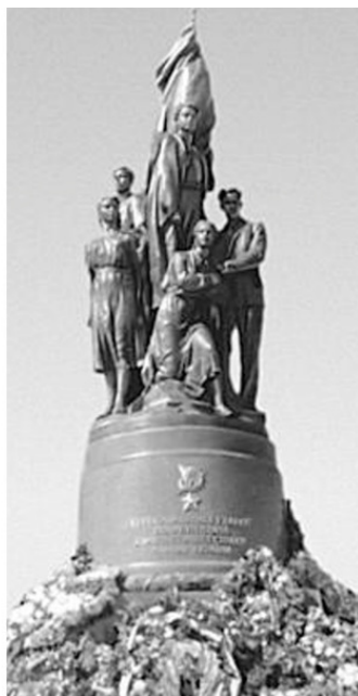
Братская могила захоронения молодогвардейцев г. Ровеньки