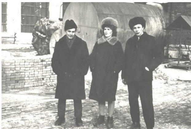
Комсомольцы – члены КП вышли в рейд