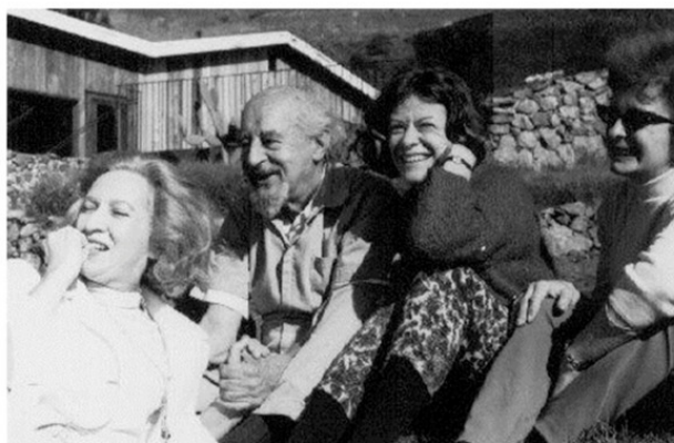
Фриц Перлз в свой первый приезд в Эсален, 1964 г

Институт был основан в 1962 г. в местечке Биг Сур в Калифорнии на берегу Тихого океана и существует по сей день. Его основатели сделали своей целью способствование гармоничному развитию человека, и в институте проводилось большое количество тренингов, направленных на самопознание и личностный рост. Благодаря работе в Эсалене Фрицу Перлзу удалось популяризировать свой метод и сделать его широко известным.