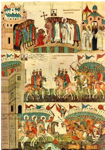
Чудо от иконы «Знамение» (Битва суздальцев с новгородцами). XV век. Новгородский музей. Икона из церкви Св. Николы Кочанова в Новгороде

Новая икона об иконе была написана в память об этом событии. В его честь Архиепископ Иоанн установил праздник Знамения Божией Матери, который Церковь отмечает 10 декабря.