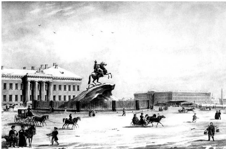
Памятник Императору Петру I на Сенатской площади. 1824–1827 гг.