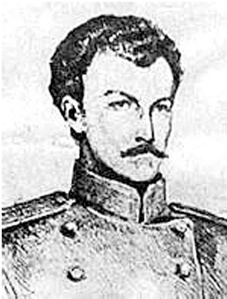
Д. А. Брянчанинов в офицерском мундире