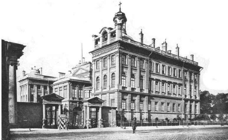
Вид Аничкова дворца с Невского проспекта

Поразительные успехи в учебе, отличное поведение, высокая нравственность юноши и явное расположение к нему Великого Князя выделяли Дмитрия среди его товарищей. К концу 1823 года вместе с переводом в верхний кондукторский класс он был назначен федьфебелем кондукторской роты, в 1824 году его перевели из юнкерских классов в нижний офицерский и 13 декабря произвели в инженер-прапорщики. Яркие умственные способности и высокие нравственные качества Брянчанинова бесспорно заставляли как учащихся, так и профессоров, отдавать ему предпочтение перед другими воспитанниками.