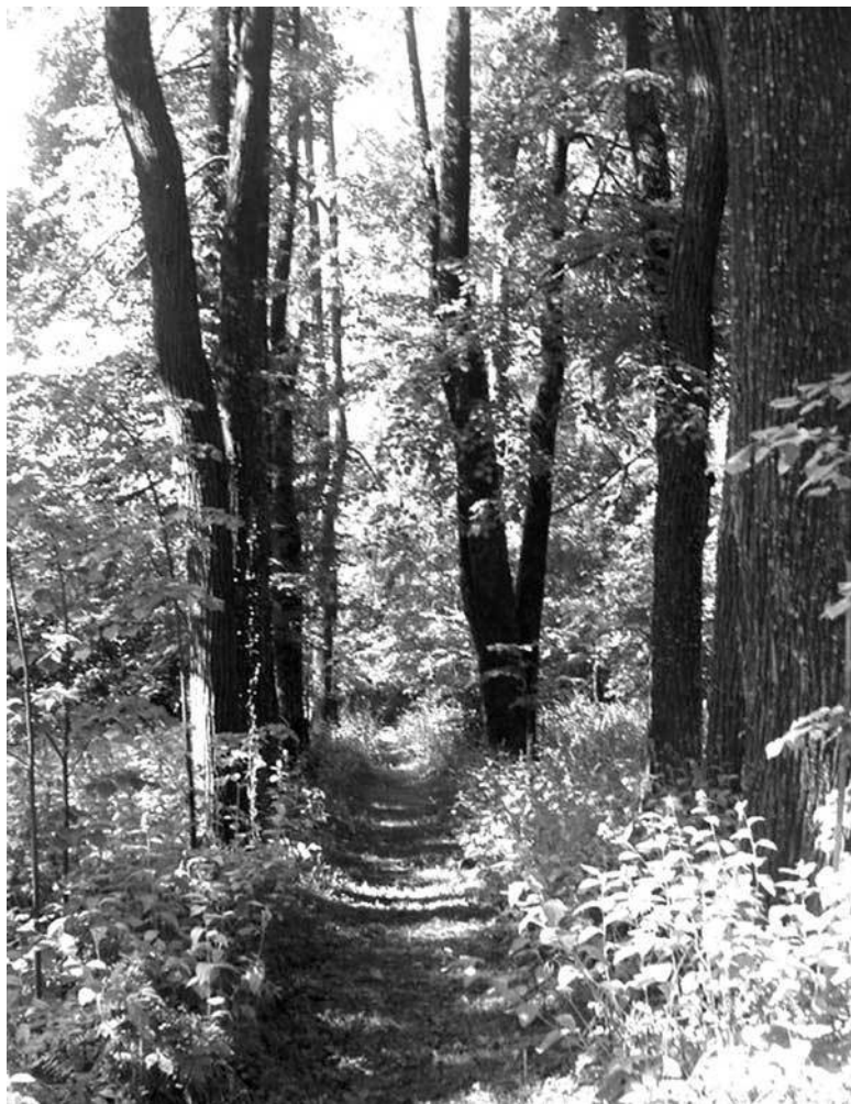
Липовая аллея в Покровском