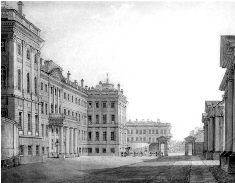
Вид Аничкова дворца с парадного двора