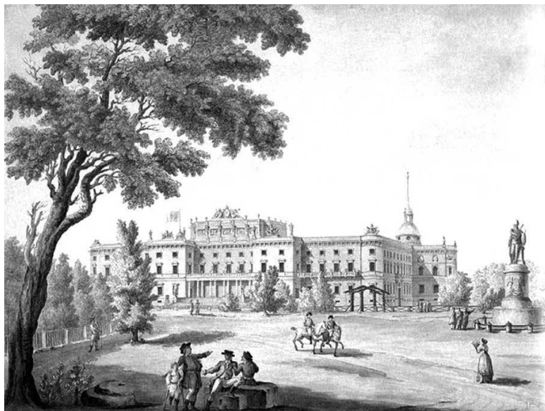
Вид на памятник А. В. Суворову и Михайловский замок

ми Дмитрию Брянчанинову. Его первые литературные опыты привлекли к нему внимание знаменитостей литературного мира, с которыми он познакомился в доме Олениных: Гнедича, Крылова, Батюшкова и Пушкина. Там, на литературных вечерах, Дмитрий стал любимым чтецом-декламатором. Советы мастеров слова оказывали благотворное влияние на формирование молодого Брянчанинова как писателя, приучая его к тщательной отделке своих произведений.