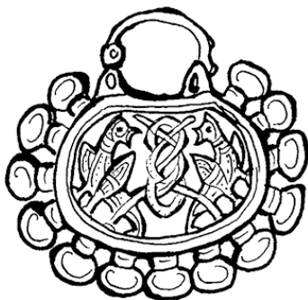
Колт – украшение женского головного убора/ Серебро,

И подумала Рогнеда: «Раз не нужна моему супругу моя любовь, незачем ему жить на свете!»