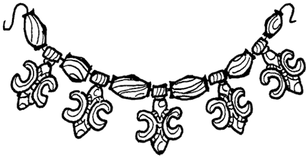
Ожерелье. Серебро, XII в.

Предслава, оставшись в одиночестве, скучала по братьям, особенно по Ярославу, и тревожилась, как-то будет он обходиться без нее и не станут ли его обижать бойкие и здоровые сверстники. Но Ярослав, несмотря на слабое здоровье и хромоту, с успехом постигал воинскую науку и выучился скакать верхом, владеть копьем и мечом ничуть не хуже братьев.