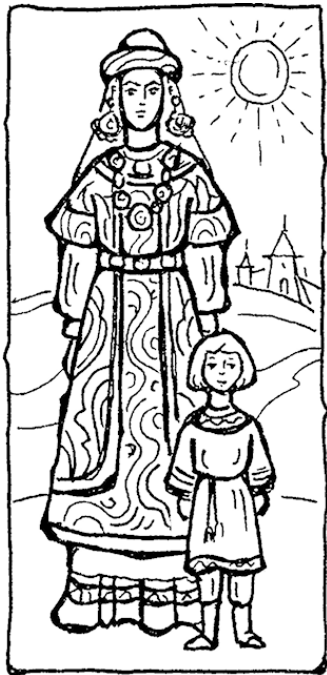
Княгиня Ольга и князь Святослав. Рис. Татьяны Муравьевой

Шло время. Игорь, продолжая то, что начал Олег, расширял свои владения. Он покорил отважных уличей, которые упорно защищали свою землю и сдали свой главный город Пересечен только после трехлетней осады. Так же упорно сопротивлялись и тиверцы, обитавшие вдоль побережья Черного моря от Нижнего Дуная до Днепра, но в конце концов