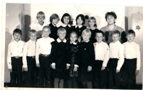
ученики первого класса Яринской школы.