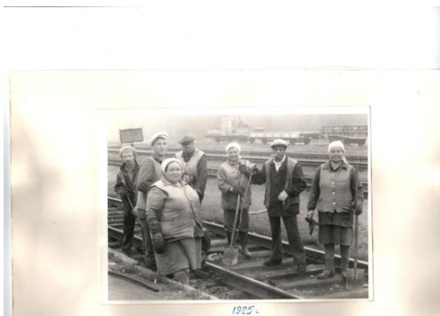
бригада монтеров путей