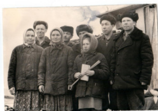
бригада по разделке хлыстов