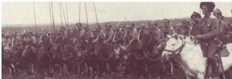
Подготовка к атаке