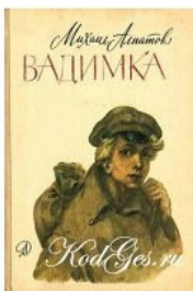
Книга Михаила Алпатова.

Оставшиеся на берегу без всякой надежды ждали появления красных. Думали, что всех убьют. Случилось иначе. Кого-то отправили под трибунал, но многим предложили вступить в Красную Армию (вспомним Григория Мелехова), а мальчишек, вроде моего отца, отпустили домой. Красно-