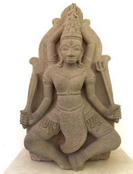
Статуя четырёхрукого Шивы. Песчаник, XI – XII в., public

Например Шива изображается чаще всего сидящим в позе лотоса, с кожей белого цвета, с синей шеей, со спутанными или скрученными в пучок на макушке (джата) волосами, носящим змею на шее, голове, руках и ногах. Да и поза лотоса – привычная для богов слишком откровенно напоминает сидящего головонога.