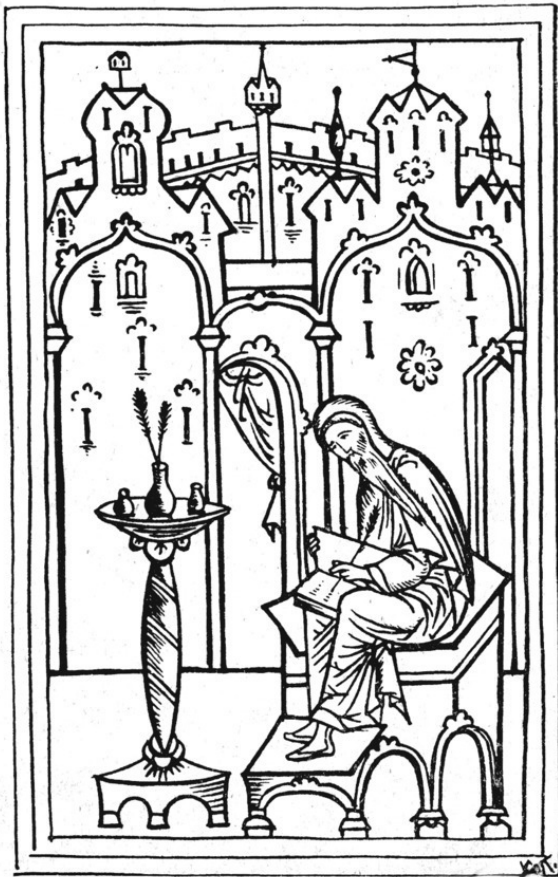
Песнотворец Иоанн Дамаскин (ок. 675 – ок. 753 или 780). Гравюра из русского журнала «Родная старина» 1933 г. (Лат- вия), посвященного знаменному пению.