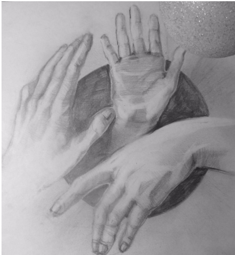
Иллюстрация Людмилы Ломака