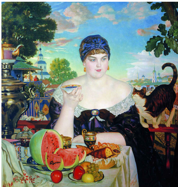
Б. М. Кустодиев. Купчиха. 1918.

Существует и иная, ещё более высокая ступень, которую можно назвать «высшим пилотажем» . Такое совершенство обмана доступно относительно немногим, но среди тех, кому он покоряется, харизматичные продавцы. Продавщики, владеющие этими навыками, обладают собственными отработанными техниками и технологиями, позволяющими им контролировать своё невербальное поведение и общаться одновременно на подсознательном и речевом уровне.