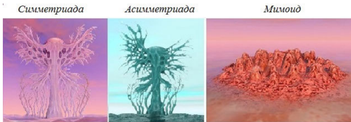
Рис.1-01. Худ. Синьоре Д. Иллюстрации к роману С.Лема «Солярис»,

Но какое содержание стоит за ними? Симметриада – это просто что-то симметричное. Соответственно Асимметриада – асимметричное. А что изображено на рисунке Мимойда уже догадаться невозможно. Так что как иллюстрации к литературному произведению эти рисунки возражений не вызывают. Но они совсем не годятся для соляристики, понимаемой в рамках идей Вернадского, то есть соляристики не как литературной фантазии, а как подлинной науки. Да это вряд ли по силам художникам. Скорей это должны делать профессиональные архитекторы и дизайнеры. И не путем досужего фантазирования, а как результат серьезного научного анализа.