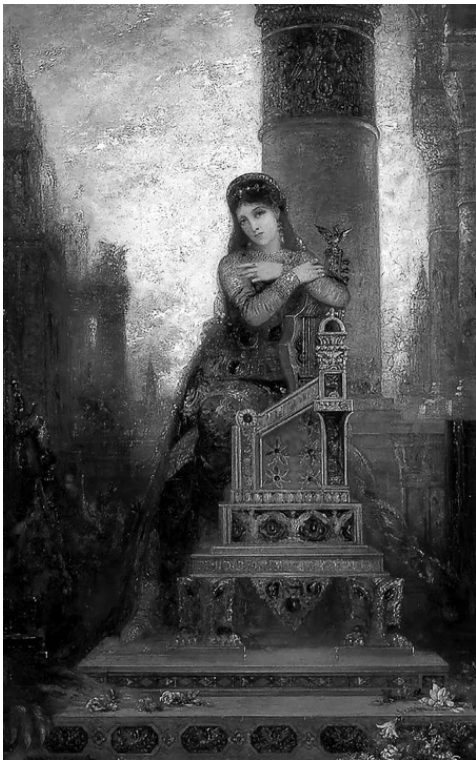
Дездемона. Гюстав Моро. 1880-е гг.

Истина приказала достать себе пёстрых шалей из Индии, прозрачного шёлка из Бруссы, золотом затканых материй из Смирны. Со дна моря она достала себе жёлтых янтарей. Убрала себя перьями птичек, таких маленьких, что они похожи на золотых мух и боятся пауков. Убрала себя брилли-