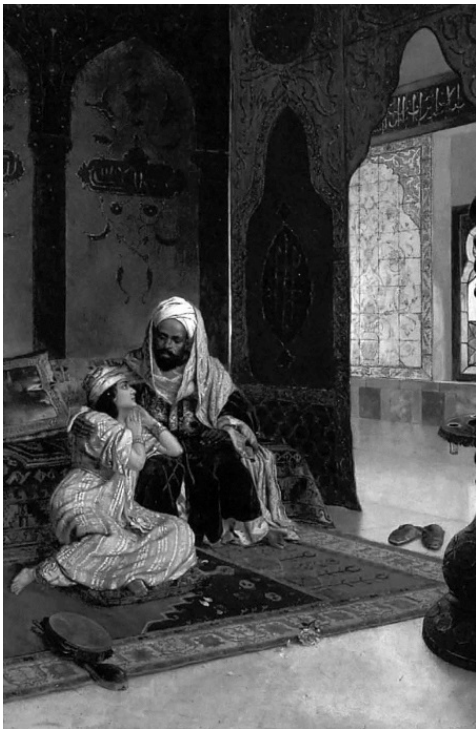
Фаворитка султана. Рудольф Эрнст. 1890-е гг.

Взяла и пошла. Одета только в свою красоту. На пороге дворца её с ужасом остановил страж.