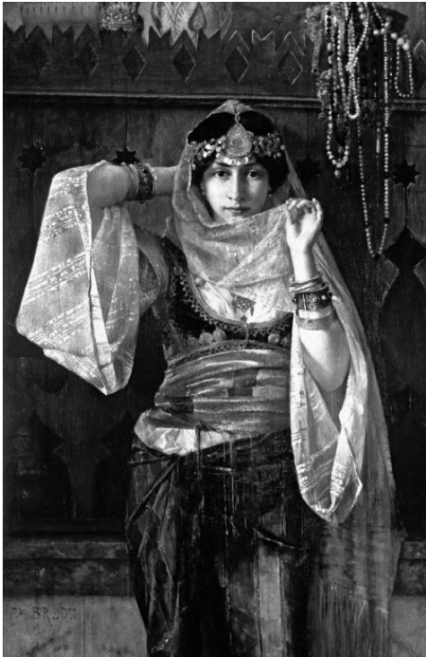
Королева гарема. Фердинанд Макс Бредт. Ранее 1921 г.

избраннику улыбнётся она, черноокая, чернокудрая, грозная красавица, которая живёт там, за дремучим лесом, за высокими горами.