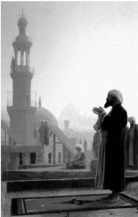
Молитва в Каире. Жан-Леон Жером. 1865 г.

Евнух улыбнулся так, как улыбаются евнухи и жабы.